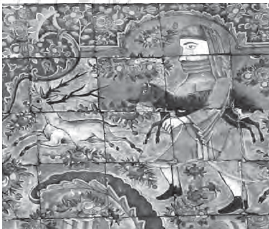
تصویر ۷- کاشی برگرفته از نقش برجسته هخامنشی با توجه به نوع پوشش آن ها، هلالی پشت عمارت اصلی، باغ ارم

اسطوره «...کلمه ای معرب است که از واژه یونانی هیسْتوریا، به معنی «جست و جو»، «آگاهی» و «داستان» گرفته شده و برای بیان مفهوم اسطوره در زبان های اروپایی از بازمانده واژه میتوس به معنی «شرح، خبر و قصه» استفاده می شود. اسطوره واکنشی از ناتوانی انسان است