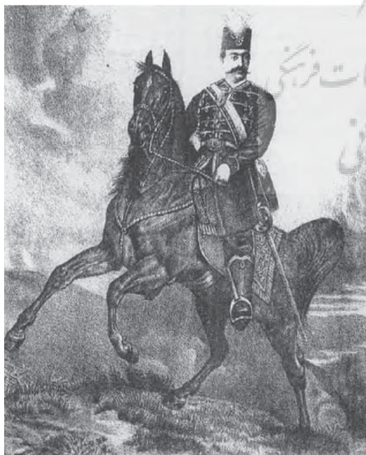
تصویر ۱۴- ناصرالدین شاه تصویر چاپ سنگی شماره دوازدهم، روزنامه شرف

سوی پادشاه و تمام رخ هستند. (تصویر ۶) این تصویر نیز از نقش برجسته ای با همین نقوش به نام «متظلم مدی» در تخت جمشید الهام گرفته شده است. پایین تر از این تصویر نقاشی هایی شبیه به نقش برجسته «هدیه آورندگان» در