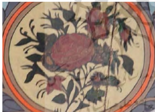
تصویر ۳۴ - نقاشی رنگ و روغن روی چوب سقف اتاق های امارت باغ ارم