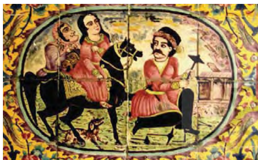
تصویر ۲۶- فرهاد کوه کن، نقاشی دیواری استراحتگاه تابستانه، باغ ارم