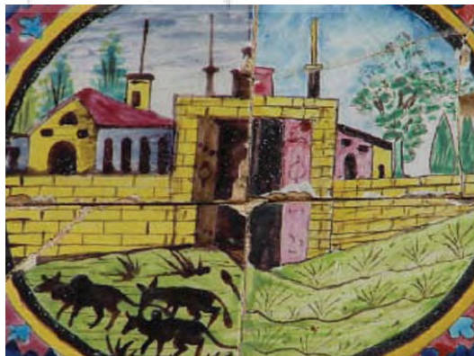
تصویر ۴۵- دورنمایی از یک روستا هنگام غروب، نقاشی به روش کاشی هفت رنگ، باغ ارم