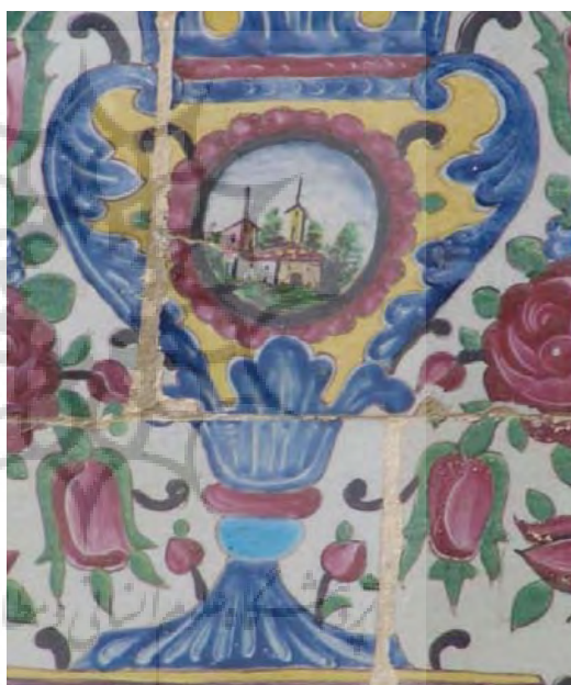
تصویر ۳۷- گلدان شکل گرفته با نقوش گیاهی، کاشی هفت رنگ، ستون های باغ ارم

نقوش اسلیمی گاه در یک سقف نقش مایه ای شبیه به نقش فرش را القا می کند که تمام متن کار را پوشانده و چنان چه نقوش دیگری در آن سطح وجود داشته باشد به تبعیت از نقوش اسلیمی است که در داخل سطح قرار گرفته اند. (تصویر ۳۵) گاه نقوش اسلیمی با حرکت و پیچش خود در امتداد کناره ها و حاشیه های یک نقش تشکیل قاب های بسیار زیبایی می دهد که نقش گیاهی و انسانی و حیوانی را در خود نگاه داشته است. (تصویر ۳۶) نقوش اسلیمی گاه با حرکت و گردش متقارن خود گلدانی را به وجود آورده که این گلدان با نقوش گیاهی طبیعی و یا تزیینی پر شده است. (تصویر ۳۷)