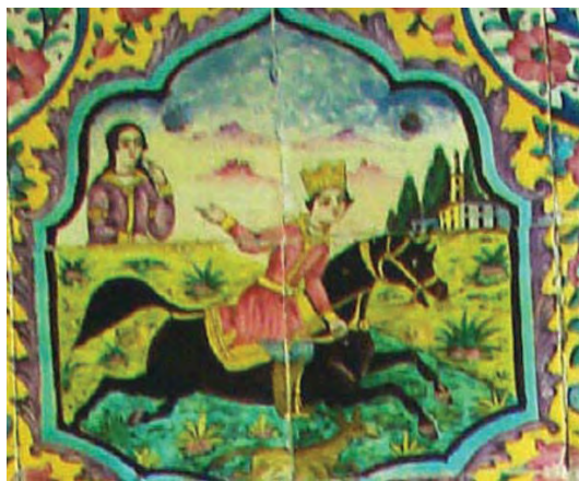
تصویر ۲۵- موضوعات داستانی، بهرام و منیژه، استراحتگاه تابستانه، باغ ارم