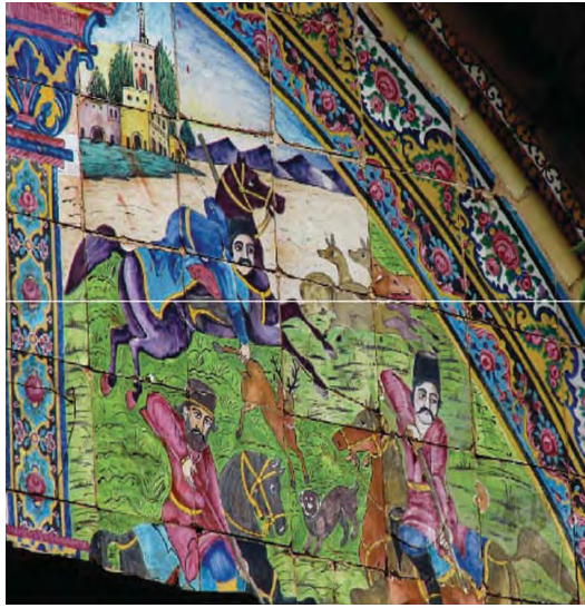
تصویر ۱۸- شکار چینان در حال شکار، بخشی از تصویر، باغ ارم هلالی پشت عمارت اصلی، روبه سمت غرب