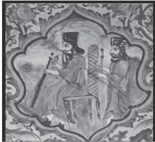
تصویر ۹- نقاشی دیواری، کاشی هفت رنگ باغ ارم شیراز، برگرفته از نقش برجسته های تخت جمشید