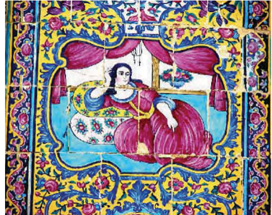
تصویر ۲۷ - دختر لمیده، کاشی هفت رنگ، نمای بیرونی عمارت باغ ارم

ناصرالدین شاه می باشد. (تصویر ۱۴) ناصرالدین شاه با لباس آبی رنگ و زیور آلات خاص پادشاهی (حمایل) سوار براسبی سفید در زمینه ومنظره ای طبیعی با شکوه و جلالی ویژه تصویر شده است.