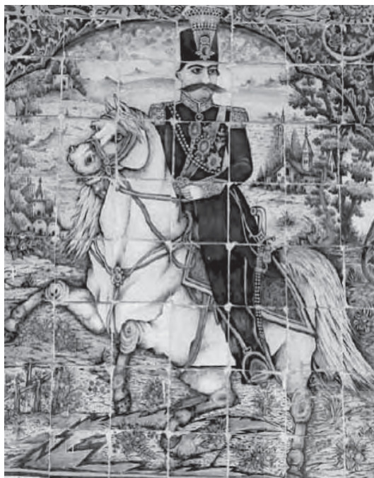
تصویر ۱۳- ناصرالدین شاه سوار بر اسب، نقاشی دیواری، کاشی هفت رنگ، هلالی مرکزی، باغ ارم