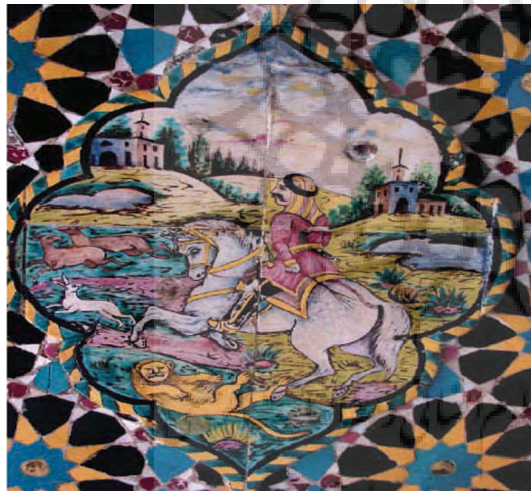
تصویر ۱۹- استراحتگاه تابستانه، کاشی، باغ ارم