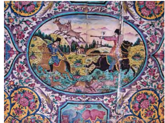
تصویر ۱۷- صحنه شکار با پس زمینه مناظر طبیعی، کاشی، باغ ارم