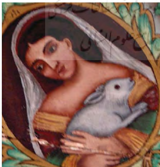
تصویر ۴۰- دختری با حیوان خانگی (خرگوش) نقاشی رنگ و روغن بر روی چوب، سقف امارت باغ ارم