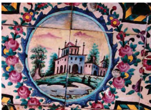
تصویر ۴۱- مناظر ساختمانی در دوردست، کاشی هفت رنگ، استراحتگاه تابستانه باغ ارم