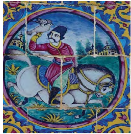
تصویر ۱۵- شاهزاده ای با باز شکاری، کاشی هفت رنگ، باغ ارم