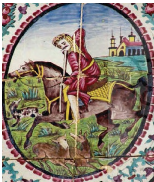
تصویر ۴۴- مردی بالباس عربی، در حال شکار با پس زمینه منظره ساختمانی، هلالی پشت عمارت اصلی باغ ارم