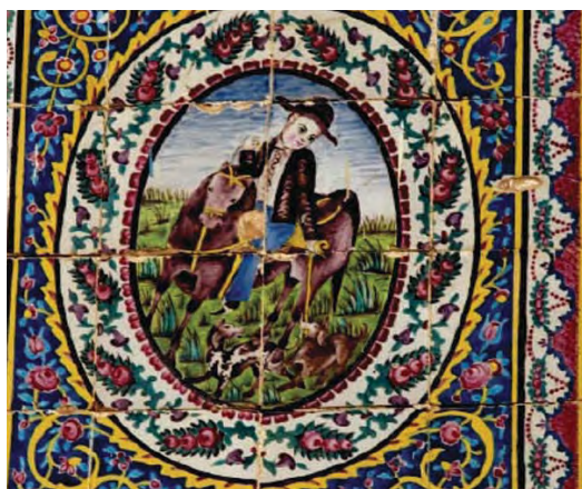
تصویر ۲۱- نقاشی به روش کاشی هفت رنگ، اروپایی مشغول بازی با سگ شکاری خود، باغ ارم