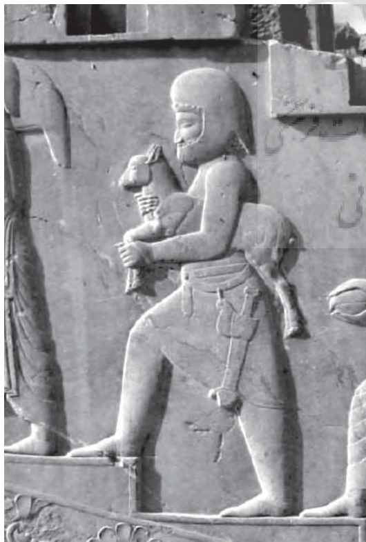
تصویر ۸- نقش برجسته هخامنشی، تخت جمشید

گرفت و گیر یا همان نبرد دو حیوان یا انسان با حیوان، به گونه ای نبرد بین دو نیروی متضاد یا خیر و شر را