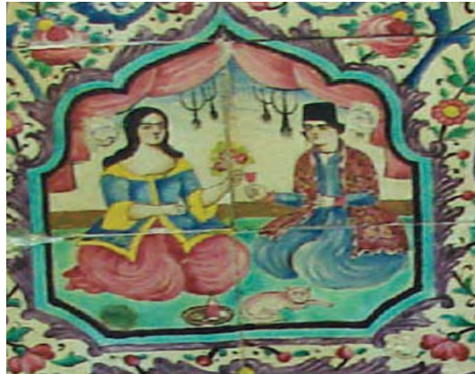
تصویر ۲۹- دو دلاده با لباس قاجاری در اتاق با پرده های قرمز رنگ، استراحتگاه تابستانه، باغ ارم