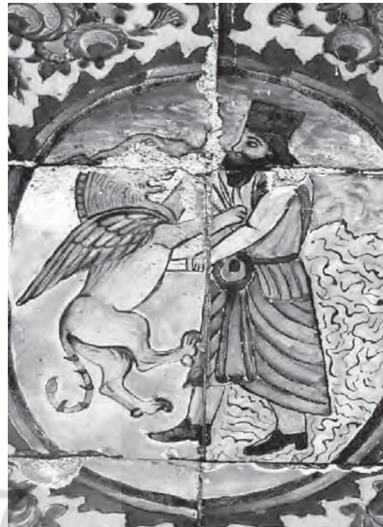
تصویر ۳ - نبرد خیر و شر، نقاشی دیواری، باغ ارم، هلالی اصلی پشت عمارت

که نیزه ای در دست دارد». (کمالی سروستانی، ۱۳۸۱، ۸۰) بررسی و طبقه بندی موضوعی نقاشی های دیواری باغ ارم شیراز