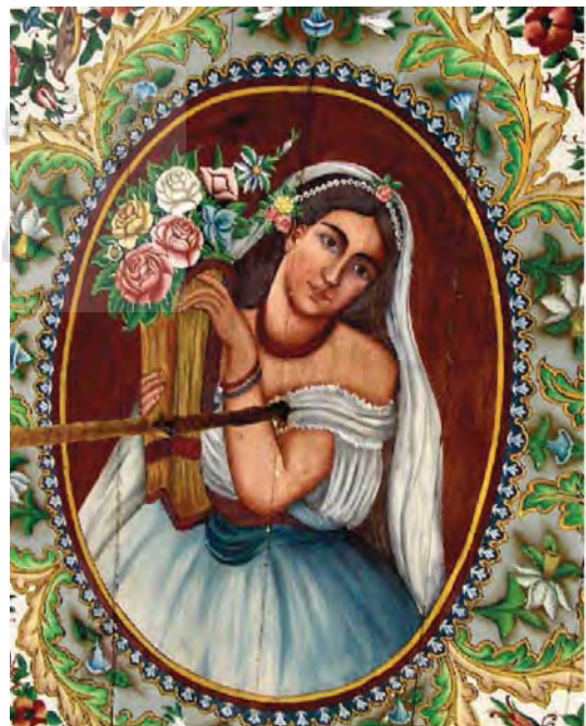
تصویر ۲۸ - رنگ و روغن روی چوب، دختر فرنگی با دسته گلی در دست، سقف تالارصلی باغ ارم

یکی دیگر از نقاشی های پادشاهان که دو ویلمورن نیز به آن اشاره کرده تصویری از ناصرالدین شاه قاجار است که بر مرکز هلالی اصلی و بزرگ عمارت باغ ارم کشیده شده است. (تصویر ۱۳) این نقاشی بر روی کاشی هفت رنگ، به شیوه اروپایی و متأثر از هنرمندان اروپایی است که سعی در واقع نمایی دارد و برداشتی از عکس واقعی