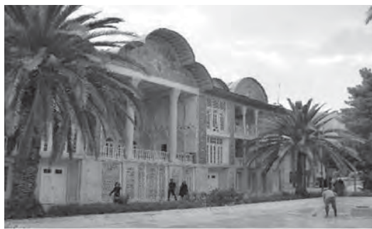
تصویر ۱ - نمایی از باغ ارم، قاجاریه