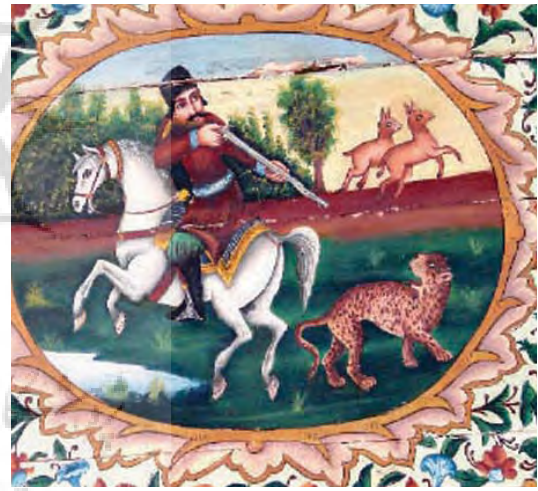
تصویر ۱۶- نقاشی روی چوب، باغ ارم