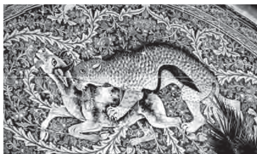
تصویر ۲ - باغ ارم، نقاشی روی کاشی هفت رنگ، نقاشی های برگرفته از اساطیر کهن، گرفت و گیر، باغ ارم

«باغ ها به طور کلی در برگیرنده سه گونه عمده باغ های میوه، سبزی کاری و تزیینی می باشند. باغ های تزیینی ایران اغلب دارای سردر ورودی مجلل یا ساده خیابان بندی، شبکه جداول پهنه های کوچک و بزرگ آب، باغچه های درخت گل و بناهای مختلف هستند. شهر شیراز نیز از دیرباز دارای باغ ها و بوستان های بسیار بوده، که هر یک بیان گر شیوه معماری و باغ سازی دوران خود بوده اند. شیراز دارای بیش از دو هزار باغ قدیمی بوده که هم اینک تنها برخی از آن ها پا برجا مانده است» (کمالی سروستانی، ۱۳۸۴، ۷۷)