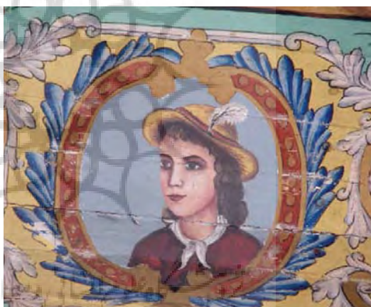
تصویر ۳۱- تالار اصلی باغ ارم، نقاشی رنگ و روغن روی چوب