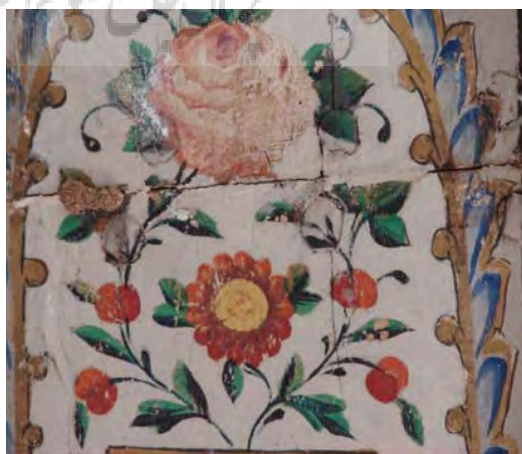
تصویر ۳۲- بخشی از تصویر، قوت قلم در ترسیم نقوش گیاهی رنگ و روغن روی چوب، سقف تالار اصلی باغ ارم