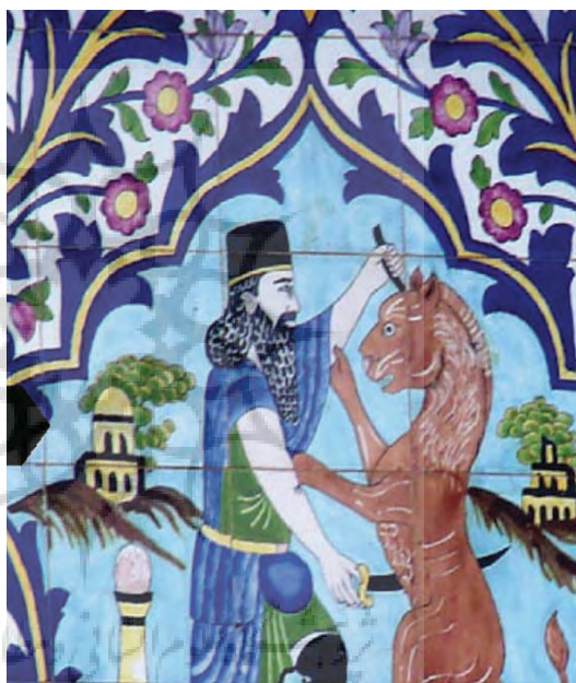
تصویر ۴۳- نقاشی با موضوع باستانی (هخامنشی) با پس زمینه منظره ساختمانی، باغ ارم