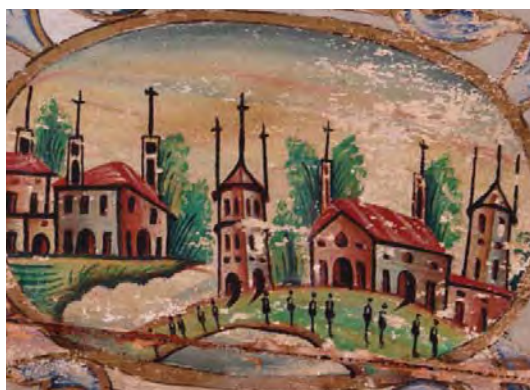
تصویر ۴۲ - تالار اصلی باغ ارم، نقاشی روی چوب