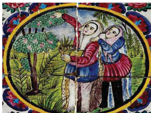
تصویر ۴۶- زنان قاجاری در حال چیدن میوه در باغ، هلالی پشت عمارت اصلی باغ ارم