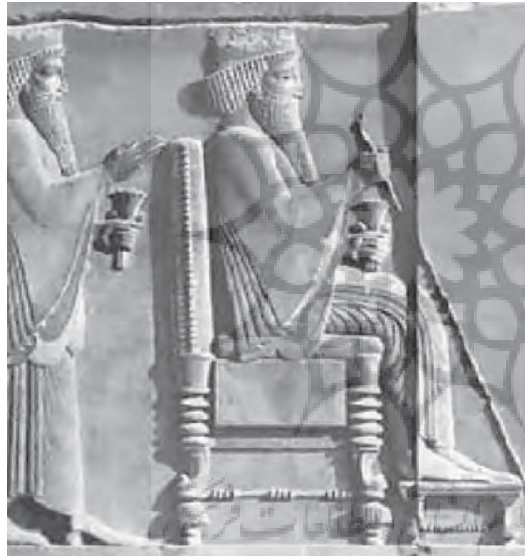
تصویر ۱۰- کوروش هخامنشی بر تخت پادشاهی، نقش برجسته، تخت جمشید