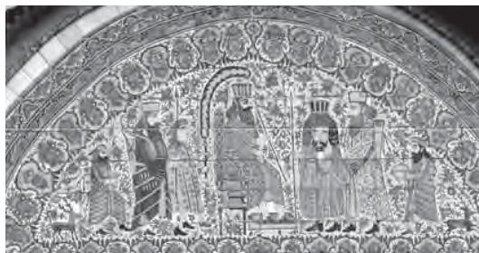
تصویر ۶- پادشاهان هخامنشی در نقاشی های دیواری باغ ارم