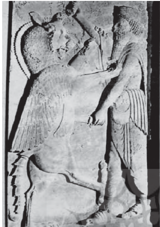
تصویر ۴ - نقش برجسته تخت جمشید، دوره هخامنشی