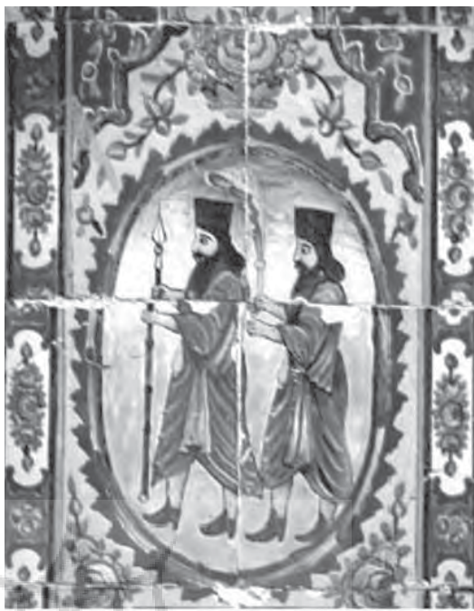
تصویر ۱۲- هلالی پشت عمارت اصلی باغ ارم روبه سمت غرب.

سوی پادشاه و تمام رخ هستند. (تصویر ۶) این تصویر نیز از نقش برجسته ای با همین نقوش به نام «متظلم مدی» در تخت جمشید الهام گرفته شده است. پایین تر از این تصویر نقاشی هایی شبیه به نقش برجسته «هدیه آورندگان» در