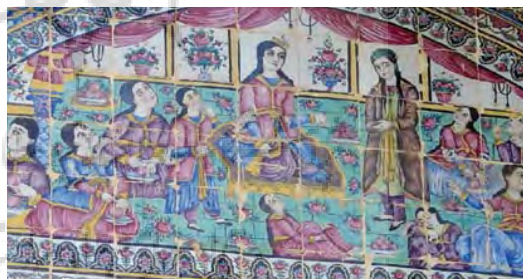
تصویر ۲۳- مجلس زلیخا، کاشی هفت رنگ هلالی مرکزی، باغ ارم

نقاشی هایی از سربازان هخامنشی، کمان داران و نیزه دارانی که گاه نکهبان آتش هم هستند و در قاب های کوچک