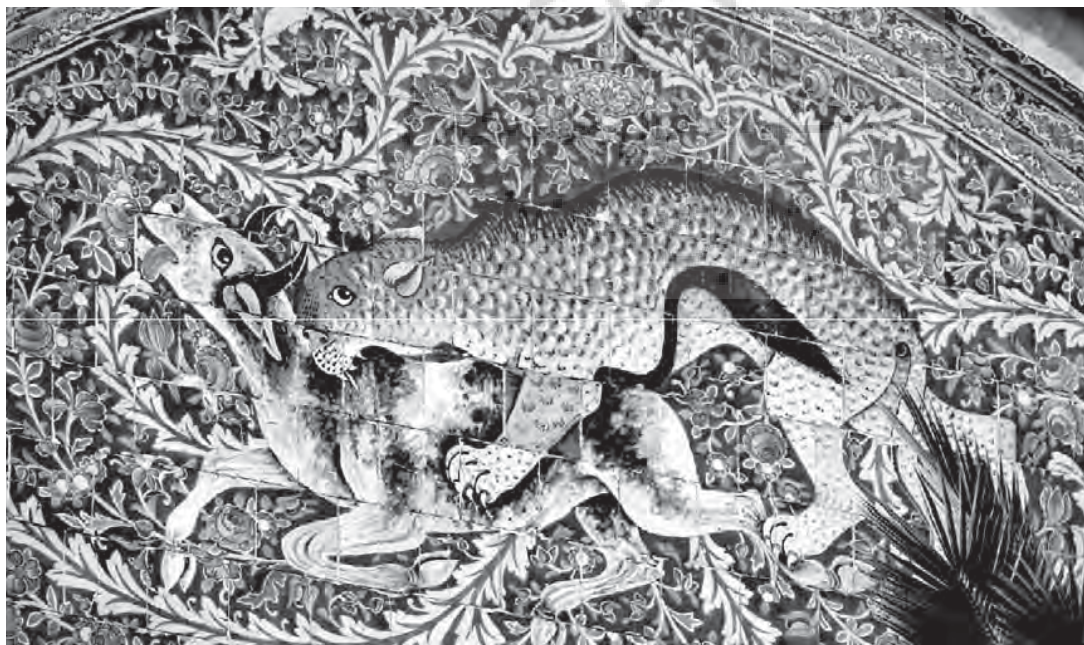
باغ ارم، نقاشی روی کاشی هفت رنگ، نقاشی های بر گرفته از اساطیر کهن، گرفت و کین، باغ ارم