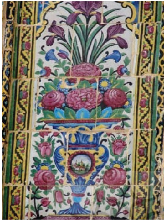
تصویر ۳۳ - نقاشی گلدان های پراز گل، کاشی هفت رنگ ستون های امارت باغ ارم