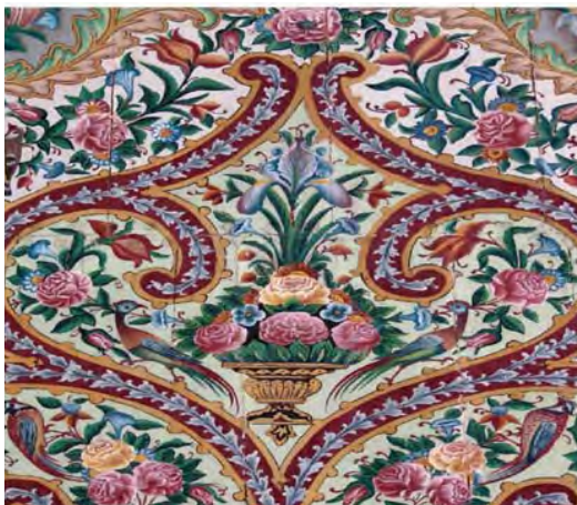
تصویر ۳۶ - تالار اصلی باغ ارم، نقاشی روی چوب

این نقوش که اغلب برگرفته از انواع گیاهان و گل های طبیعی است و جای جای سقف و دیوارها را پوشانده و بر روی کاشی های هفت رنگ یا رنگ و روغن روی چوب یا گچ، نقاشی شده اند. نقاشان عمارت باغ ارم، گاه با حرکت سریع قلم و گاه با تمام دقت و ظرافت به ترسیم گل ها و گیاهان این بنا پرداخته اند. بعضی از نقوش با چنان مهارت، دقت و قدرت کار شده اند که ضرب قلم «لطفعلی صورتگر» را تداعی می کند (تصویر ۳۲) نقوش گیاهی به صورت دسته گلی دست دختران جوان، گلدان های پر از گل و گاه در قاب هایی به صورت چند شاخه و گاه در ترکیب درختچه ای، خود نمایی می کند. (تصاویر ۳۳ و ۳۴)