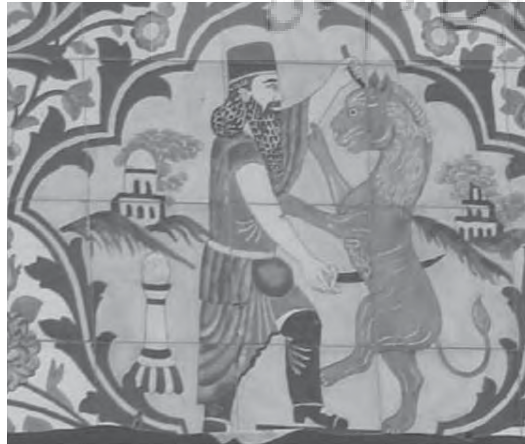
تصویر ۱۱- پادشاه هخامنشی در حال نبرد با حیوان اساطیری (نماد شر)، باغ ارم

بیان می کند که «ثنویت مشخصه دین زردشتی است و آن اعتقاد به وجود دو نیروی اساسا متضاد است که دست اندر کارند.