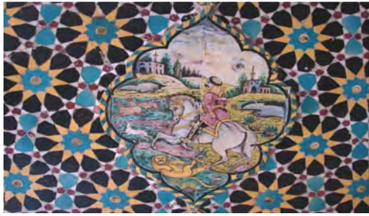
تصویر ۳۸- سقف امارت باغ ارم، نقش هندسی (گره چینی) و تلفیق آن با کاشی هفت رنگ