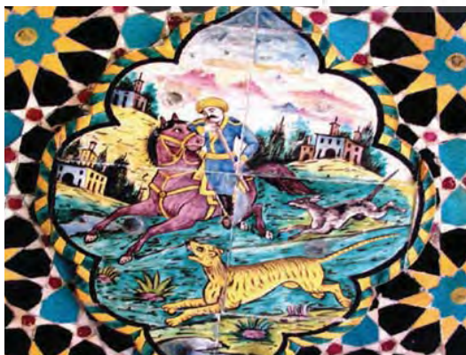
تصویر ۲۰- صحنه شکار، کاشی هفت رنگ، استراحتگاه تابستانه، باغ ارم