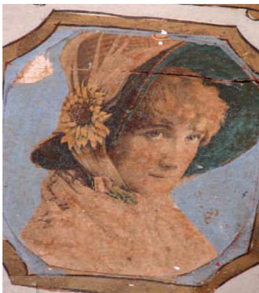
تصویر ۳۰- تالار اصلی باغ ارم، اعلان (اروپایی) نصب شده بر روی زمینه نقاشی شده بر روی سقف چوبی

تصاویر دلداده گان، زنان و دختران جوان اغلب از نیم تنه و چهره، سه رخ ترسیم شده است. این موضوع اغلب فضای نقاشی ها را به خود اختصاص داده است. این نقوش بر روی قاب هایی که روی ستون های نمای شرقی و نمای غربی (اندرونی) قرار دارند و در داخل بنا و