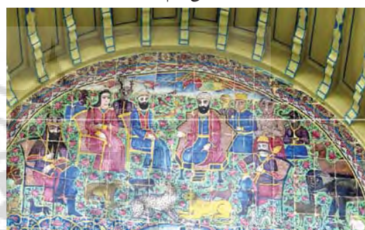
تصویر ۲۲- داستان حضرت سلیمان، کاشی هفت رنگ هلالی میانی نمای بیرونی امارت باغ ارم

تخت جمشید ترسیم شده اما با تفاوت هایی که کاملاً ذوق و سلیقه نقاش در آن مشهود می باشد. (تصویر ۷) با توجه به تصویر ۸ که از نقش برجسته های تخت جمشید است و مقایسه آن با تصویر ۷، و توجه هنرمند به نقوش باستانی و خلاقیت او آشکار می شود. هنرمند ایده و نقوش را از نقش برجسته ها گرفته اما با تصورات ذهنی خویش در آمیخته است، چه در تک عناصرها مانند لباس و یا شکل کلاه ها و چه در ترکیب کلی موضوع.