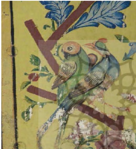
تصویر ۳۹- دوپرنده (قرقاوول و طوطی) رنگ و روغن روی چوب، سقف امارت باغ ارم