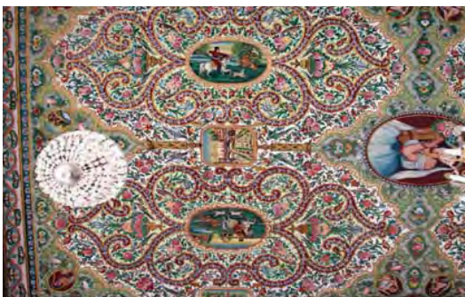
تصویر ۳۵ - سقف تالار اصلی باغ ارم، نقاشی رنگ و روغن روی چوب

بر روی سقف ها، در میان نقوش و در قاب های متعدد به صورت نقاشی بر روی کاش هفت رنگ و یا روی چوب و گچ تصویر شده اند. چهره زنان و دختران جوان گاه در حالت لمبیده (تصویر ۲۷) و یا به صورت نیم تنه با شاخه گلی در دست و یا در حال بازی با حیوان خانگی و غیره که اغلب کلاه های فرنگی و یا روسری های محلی (چارقد) سفید رنگ به سر دارند، دیده می شود. یکی از این نقاشی ها که ابعاد بزرگی هم دارد و به شیوه نقاشی رنگ و روغن روی چوب بر سقف چوبی سالن پذیرایی (تالار اصلی) قرار دارد. (تصویر ۲۸) این تصویر نیم تنه زنی را نشان می دهد که با روسری، لباسی سفید و دسته گلی در دست، سیمایی شبیه به ایرانیان دارد.