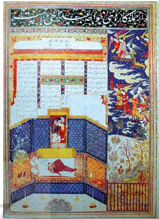
تصویر ۳- در خواب فرشته (جبرئیل)، ورق جدا شده از آلبوم بغداد، بدون رقم، منسوب به عبدالحی، سال ۱۳۹۶، اندازه ۵/۱۹×۲۸/۵ سانتی متر، موزه توپقاپی استانبول

امالی شیخ صدوق، احتجاج طبرسی، وسائل الشیعه شیخ حرعاملی و مستدرک محقق نوری نیز به معراج اشاره شده است.