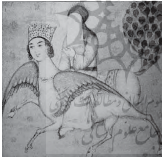
تصویر ۲۰-۲۰ هند، براق، بدون رقم، بدون تاریخ