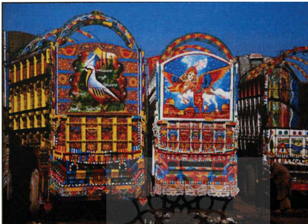
تصویر ۳۱- پاکستان، نقاشی بر روی ماشین، بدون رقم، بدون تاریخ