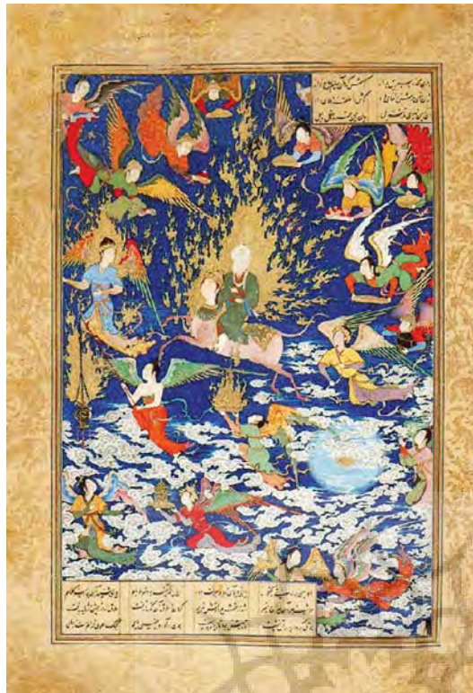
تصویر ۸- معراج، خمسه نظامی شاه طهماسبی، اثر سلطان محمد، تبریز ۹۴۶-۹۵۰ هجری قمری، کتابخانه بریتانیا لندن