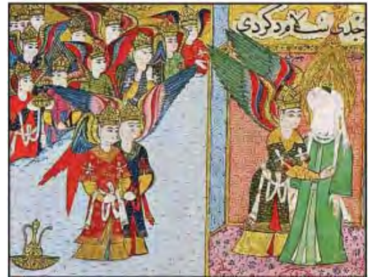
تصویر ۲۳- عثمانی، بی تاریخ، احتمالاً سیرالنبی، مجموعه اسپنسر، کتابخانه ملی نیویورک

در سال ۱۲۲۴ میلادی در آناتولی اقامت گزیدند. این گروه مهاجر در خانواده سلجوق پذیرفته و بعدها دارای مقام عالیه اداری شدند. در سال ۱۳۰۰ میلادی سلسله پادشاهی عثمانی بنیان گذاشته شد و تا سال ۱۹۳۶ میلادی ادامه داشت. (کارل جی، ۱۳۶۳، ۱۴۹)