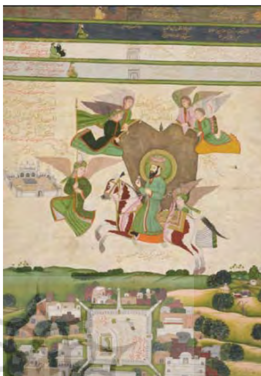
تصویر ۲۱- هند (دهلی)، معراج حضرت پیامبر(ص) احاطه شده با فرشتگان، ۱۸۰۰ میلادی، ۶۱/۵×۴۲/۵ سانتی متر

نقاشی، نگارگری، مجسمه‌سازی و غیره از دستاوردهای این دوران می‌باشد. (همان، ۱۸۸-۱۸۵) (مجموعه تصاویر ۱۹) نقاشی‌هایی با موضوع معراج در کشورهای اسلامی اهل تسنن اکثریت مسلمانان جهان را تشکیل می‌دهند. آن‌ها استفاده از صورتگری را برای نمایش تعالیم دینی و تاریخ اسلام جایز ندانسته و منع می‌کنند. اهل تسنن مخالف نصب تصاویر در مساجد هستند و هرگونه نقاشی یا پیکره‌ای که موجودات زنده را به نمایش بگذارد حرام می‌شمارند و معتقدند در هنر مقدس اسلام نقاشی پیکره، حیوانات و انسان جایز نیست.