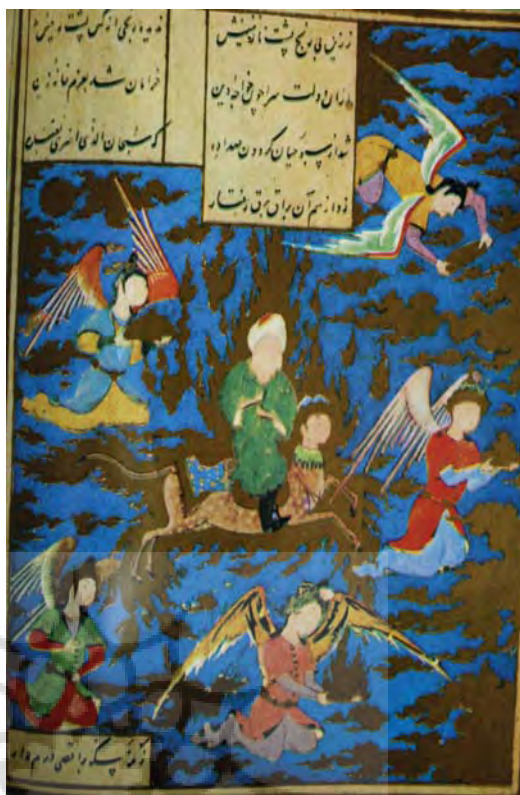
تصویر ۹- معراج، یوسف و زلیخا جامی، ۹۴۰ هجری قمری، کتابخانه قاهره

از نقاشی - طراحی که دارای ترکیب بندی های غیر پیچیده، منظره پردازی ساده و با زمینه رنگ پریده، علف‌ها و گیاهانی که به صورت قالبی و هندسی قرار می‌گیرند و با رنگ سبز و گیاهان زرد، پیکره‌های چاق با چهره گرد و ابروهای کمانی و دماغ‌ها و دهان‌های کوچک نقش داشته است. او مجموعه ای را به نام خاوران نامه نقاشی کرده است که یکی از تصاویر آن معراج پیامبر (ص) می باشد. (تصویر ۷) تنوع رنگ در تصویر زیاد است اما عمده رنگ‌های به کار رفته قرمز، آبی و طلایی می باشد و رنگ‌ها بیش تر به صورت خاکستری استفاده شده است. فرشته‌های اطراف اغلب یک شکل و یک اندازه به حالت خپل و کوتاه با دهان و بینی کوچک و ابروان کمانی تصویر شده‌اند و به نظر می‌رسد فقط از نظر رنگ و جهت نگاه با یکدیگر تفاوت دارند. حرکت حضرت پیامبر (ص) از سمت راست تصویر به داخل قاب است. ترکیب بندی تصویر به صورت حلزونی است و از فرشته ای که در سمت راست تصویر قرار دارد و دارای بال‌هایی به رنگ بنفش است شروع و به مرکز یعنی براق و فرشته ای که در بالای سر پیامبر قرار دارد، ختم می‌شود. با روی کار آمدن شاه اسماعیل صفوی در تبریز حکومت وی آغاز شد. در این زمان سلطان محمد، هنرمند معروف و خوش آوازه عرصه هنر ایران نیز می‌زیست