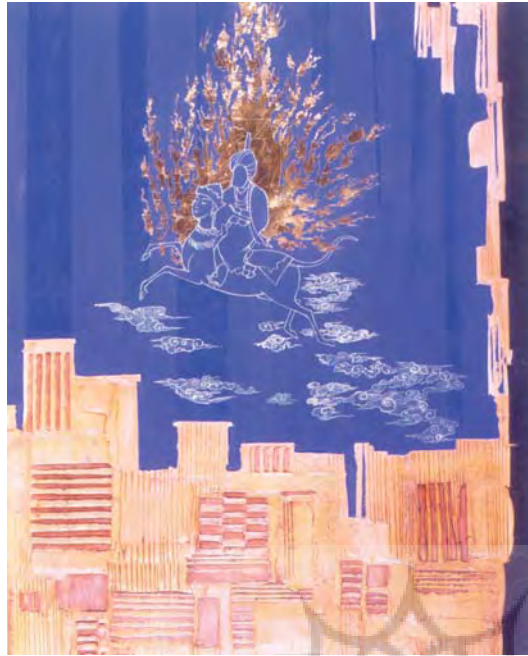
تصویر ۱۹-۲ معراج، ایرج، اسکندری، فرهنگستان هنر، ۱۳۸۴، ترکیب مواد، ۱۶۰×۱۰۰ سانتی متر