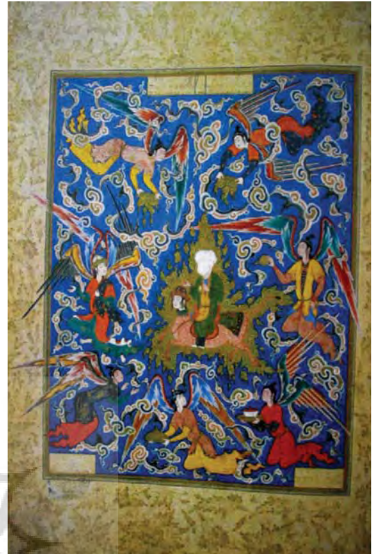
تصویر ۱۱: معراج، هفت اورنگ جامی، ۷۲-۹۳۶ هجری قمری، ابعاد ۲۳/۵×۳۴ سانتی متر

در این زمان سبک درباری ابراهیم میرزا بسیار ساده شد و نتیجه آن تعداد زیادی نسخ خطی است. مهم ترین مشخصه نقاشی های این دوره جدول های رنگ آمیزی شده شدید و دقیق با پرده رنگ های غنی منظره، زمین و آسمان است. درتصویری که از این دوران به دست