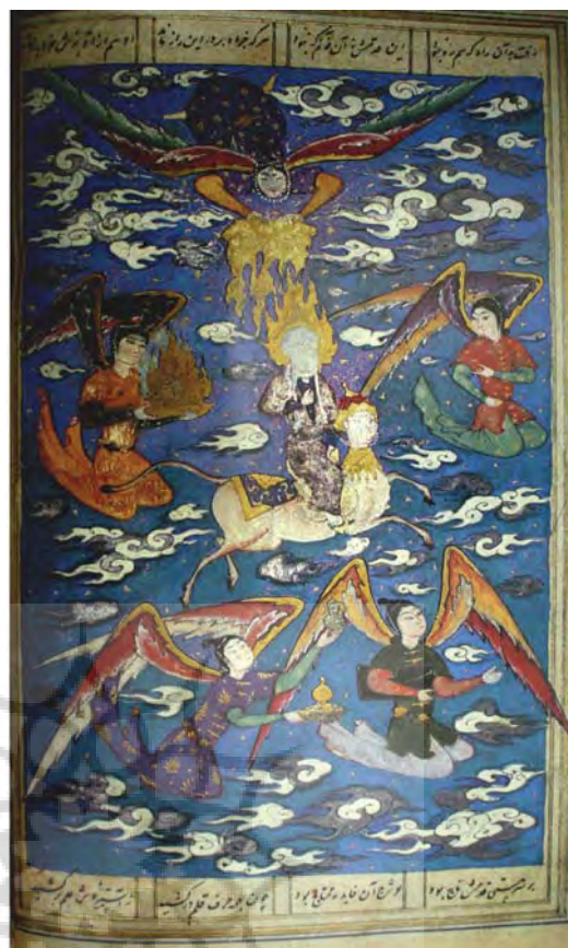
تصویر ۵- بدون عنوان، متعلق به نسخه خطی موجود در دارالکتب مصر، هرات، بدون رقم