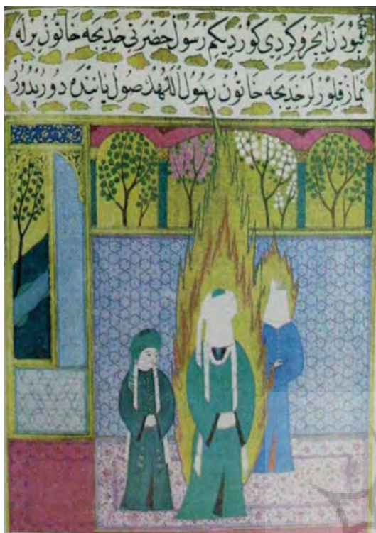
تصویر ۲۲- عثمانی، اولین نماز اسلام، سیرالنبی، مجموعه اسپنس، کتابخانه ملی نیویورک