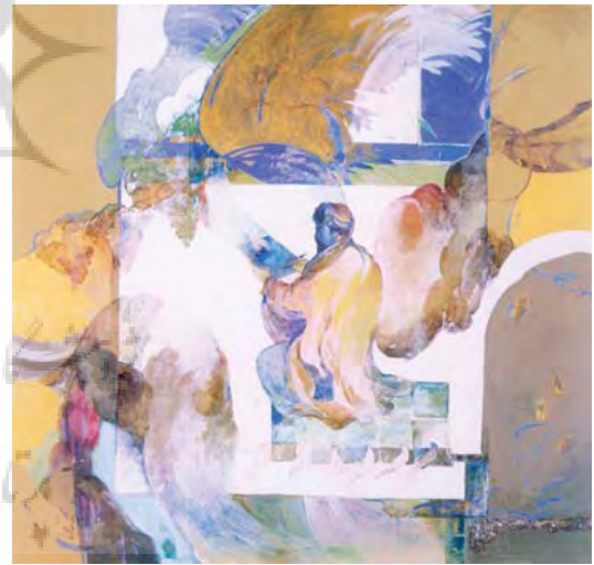
تصویر ۱۹-۳ معراج حبیب ا... صادقی، فرهنگستان هنر، ۱۳۸۴، ترکیب مواد ۱۰۰×۱۰۰ سانتی متر

وسایر عناصر دارای رنگ های گرم هستند. در این اثر برخلاف تمام تصاویر قبلی هیچ فرشته ای دیده نمی شود و هنرمند از به کارگیری شخصیت های اضافی خودداری کرده است.