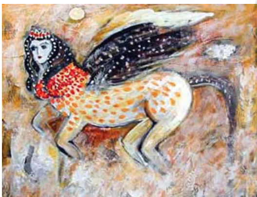
تصویر ۲۷- عراق، براق، بدون تاریخ، بدون رقم