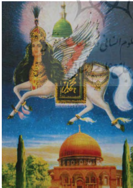
تصویر ۳۰- نیجریه، بدون رقم، بدون تاریخ

موجودی مونث می بینیم. عنصر تزئینی و توجه به جزئیات و استفاده زیاد از رنگ سبز از ویژگی های مشخص این کشور می باشد (تصویر ۲۴) به دلیل تعصبات مذهبی نقاش از ترسیم تصویر حضرت محمد(ص) خودداری کرده و فقط حضور براق نشان از واقعه معراج دارد و محل قرارگیری آن به شکلی است که نشان می دهد بالاتر از سطح زمین قرار دارد و زمینه پشت سر حضرت پیامبر(ص) نیز به رنگ آبی نقاشی شده که تاکید بر آسمان دارد و نشان می دهد براق در آسمان حرکت می کند.