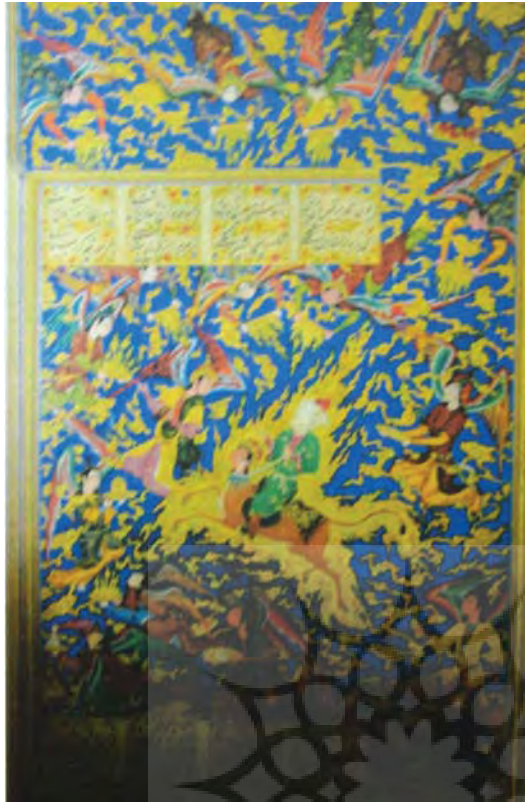
تصویر ۱۲- خمسه نظامی سال ۹۵۶ هجری قمری، هنرمند نامعلوم، مدرسه شهید مطهری

تصویر شده، حرکت از راست به چپ می باشد. (تصویر ۹) در این تصویر ابرهای چینی سفید و خاکستری رنگ حذف شده و به صورت طلایی نمایان شده است. عمده رنگ به کار رفته در تصاویر نیز آبی، طلایی، قرمز و سفید می باشد. شاه طهماسب از اواخر دهه ۹۴۷ هجری قمری دست از حمایت نقاشان کشید و در سال ۹۵۵ هجری قمری و یا ۹۶۲ هجری قمری پایتخت خود را به قزوین منتقل کرد. در ربع سوم سده دهم هجری قمری برادرزاده او ابراهیم میرزا در مشهد تعدادی از نقاشان را به خدمت گرفت و نقاشی بار دیگر مورد حمایت دربار قرار گرفت. در نگاره‌های این زمان تلاش زیادی برای نشان دادن دوره جوانی شده است. تکامل شیوه خطی و رنگ آمیزی غنی و تاثیرگذار است. پس زمینه عموماً مسطح و گاه با چندگانه و ابر نقش شده‌اند. اما در اواخر سده دهم هجری قمری و اوایل سده یازدهم هجری قمری سبک دیگری از نقاشی که به ایالتی، تجاری خراسان و استرآباد (رایبسنون، ۱۳۷۶، ۶۱) معروف شد، شکل گرفت.