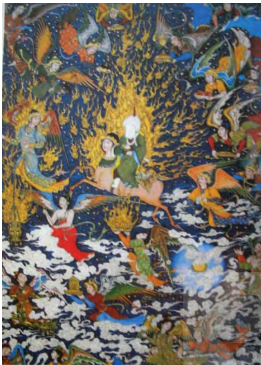
تصویر ۱۸- معراج، علی اکبر مطیع، برداشت از اثر سلطان محمد ۲۰×۲۸ سانتی متر