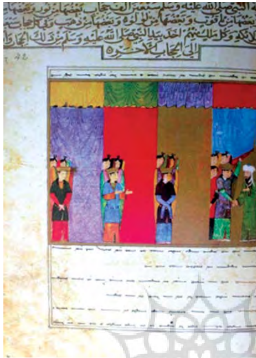
تصویر ۴- هفتاد هزار پرده، معراج نامه، هرات، ۸۴۰-۱۴۳۶، کتابخانه ملی پاریس