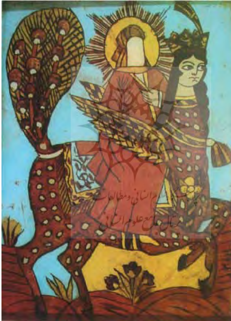
معراج حضرت پیامبر اکرم (ص)، رنگ روغن پشت شیشه، ۱۹×۲۴ سانتی متر، بدون رقم، بدون تاریخ، مجموعه خصوصی