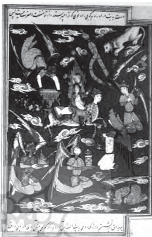
تصویر ۱۳- حضرت محمد(ص) در معراج، ۳۱/۸×۱۹/۵ سانتی متر

آمده (تصویر ۱۰) جبرئیل دیده نمی شود. حرکت براق از سمت راست به چپ تصویر می باشد و هاله ای نور اطراف حضرت پیامبر(ص) و براق را احاطه کرده است. این هاله به شکلی است که به صورت یکپارچه از پایین پای براق تا بالای سر حضرت پیامبر(ص) و اطراف ایشان در برگرفته است. عمده رنگ به کار رفته طلایی و آبی می باشد و جهت حرکت حضرت پیامبر(ص) از راست به چپ است. رنگ براق و پیامبر(ص) تیره کار شده و رنگ سفیدی که صورت و عمامه حضرت پیامبر(ص) را پوشانده و نیز کلاه سبز رنگی که بر سر براق گذاشته پاکی و طهارت را نشان می دهد. همچنین ترکیب بندی تصویر به صورت مارپیچ است.