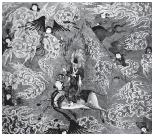
تصویر ۶- معراج حضرت محمد (ص)، خمسه نظامی، شیراز یا تبریز، بدون رقم، مکتب ترکمانان، حدود ۹۱۱ هجری قمری، کتابخانه ایندیافیس