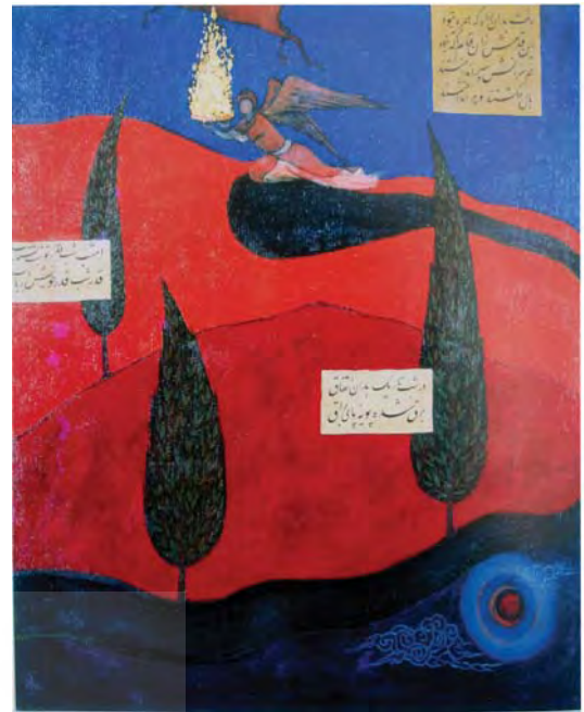
تصویر ۱۹-۱ معراج، عبدالمجید حسینی‌راد، فرهنگستان هنر، ۱۳۸۴، رنگ روغن روی بوم، ۱۴۰×۱۲۰ سانتی متر