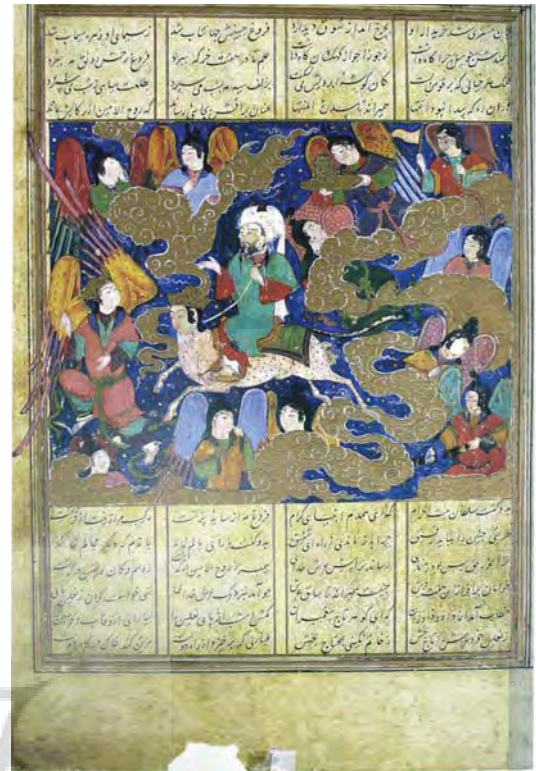
تصویر ۷- معراج حضرت رسول اکرم (ص)، خاوران‌نامه، رقم فراهاد، کاخ گلستان، تهران

را به زیبایی تصویر کرده است. (تصویر ۸) این تصویر معراج نامه جزء معدود آثاری است که براق در آن حضور ندارد و دلیل آن هم این است که نقاش می خواسته نشان دهد که براق و جبرئیل اجازه ورود به این محل را ندارند. انتخاب رنگ ها در این تصویر به گونه ای است که هریک نمادی از یک موضوع هستند، قرمز نشانه یاقوت آتشین، طلایی نماد نور و غیره است. عمده رنگ های مورد استفاده در تصویر قرمز، بنفش، طلایی، زرد و غیره است که این رنگ ها در قسمت های مختلف تصویر تکرار شده اند. تنها در یک جا رنگ سفید دیده می شود و آن هم رنگ عمامه حضرت پیامبر (ص) است که نشان گر پاکی ایشان است. قلم گیری های تصویر با رنگ های گرم انجام شده و از ویژگی های نقاشی این دوره است. همچنین عناصر تزئینی در تصویر دیده نمی شود و قسمت های مختلف تصویر و پیکره ها در نهایت سادگی ترسیم شده اند و فقط پرده ها اندکی تزیین شده اند.