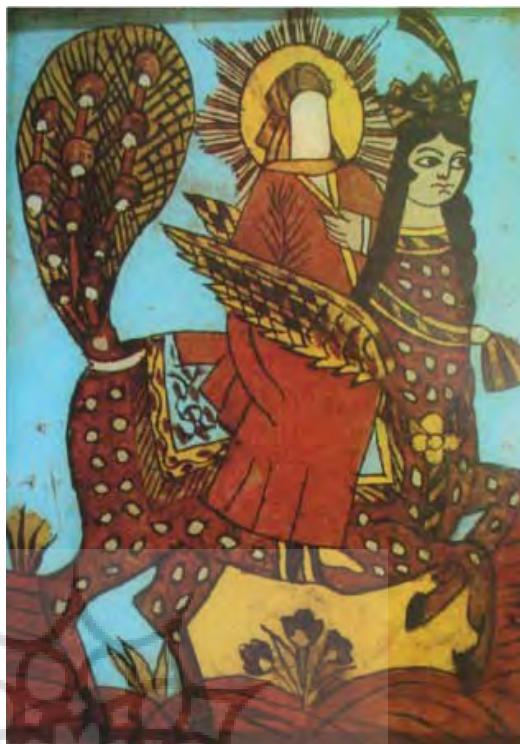
تصویر ۱۷- قاجار، معراج حضرت پیامبر اکرم(ص)، رنگ روغن پشت شیشه ۱۹×۲۴ سانتی متر، بدون رقم، بدون تاریخ، مجموعه

می باشند. (همان، ۱۶۸-۱۶۲) در تصاویر به دست آمده از این دوران شاهد دیوارنگاره هایی با موضوع معراج هستیم که در حمام وکیل نقاشی شده است. (تصویر ۱۵) این دیوارنگاره ها بدون رنگ و تزئین کشیده شده و نقاش با پرهیز از هرنوع اضافه گویی به بیان واقعه معراج پرداخته است.