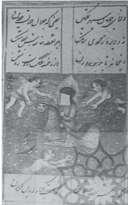
تصویر ۱۶- قاجار، بی نام، بدون رقم