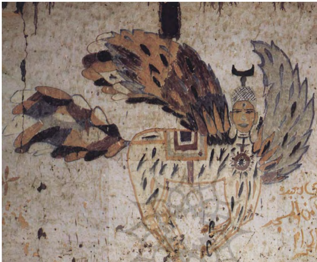
تصویر ۲۵- مصر، براق، هنر مردمی، بدون رقم