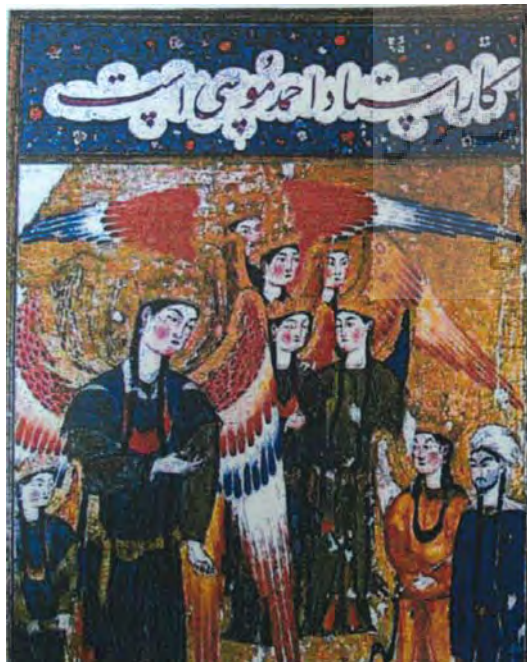
تصویر ۲- پیامبر و جبرئیل فرشته در مقابل یک فرشته عظیم‌الجثه ایستاده‌اند، رقم احمد موسی، معراج نامه تبریز، توپقاپی سرای استانبول

هنر اسلامی با کتابت قرآن کریم آغاز شد. چیزی نگذشت که پای نقش و نگارها به میان آمد، سرلوحه‌ها آراسته شد و سرآغاز سوره‌ها به حاشیه رنگین پیراسته شد و گرایش به ترجمه و نگارش متون علمی، تاریخی و ادبی در سده‌های بعد متجلی شد. تصاویر انسان، حیوان، گیاهان و نباتات به نسخه‌های دست‌نوشته راه یافت و استفاده از کاغذ به جای پوست برای کتابت راه را برای اعتلای کتاب‌آرایی