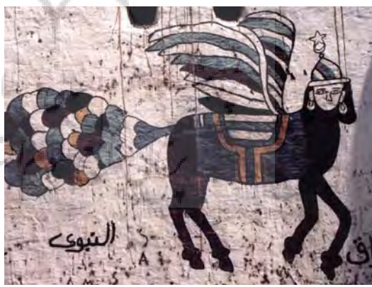
تصویر ۲۶- مصر، براق، هنر مردمی، بدون رقم

سبز و حاصل خیزی را در این پهنه خشک و سوزان ایجاد نموده، به همین دلیل می توان آن را شاهرگ حیاتی تمدن مصر دانست.