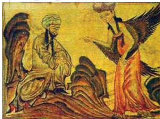
تصویر ۱- شب معراج، حضرت محمد(ص) بر روی براق، جامع التواریخ بدون رقم، بدون تاریخ، توپقاپی سرای استانبول