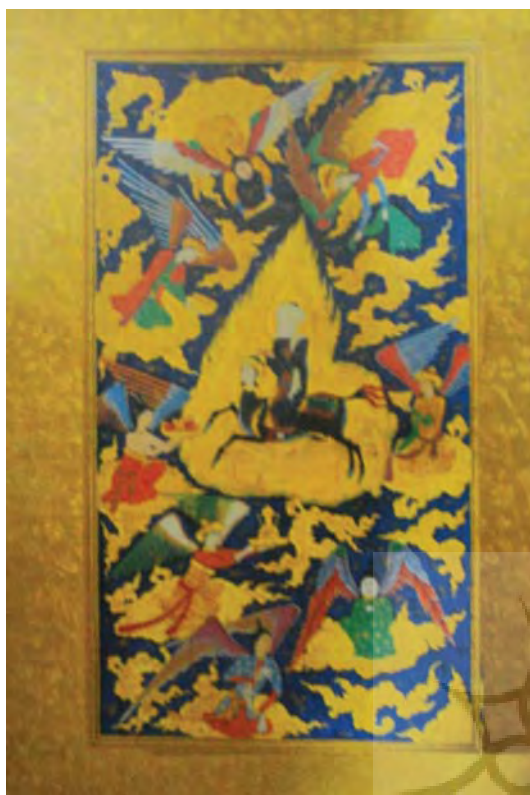
تصویر ۱۰- معراج، حبیب‌السیر خواندمیر، کاتب نامعلوم، موزه کاخ گلستان