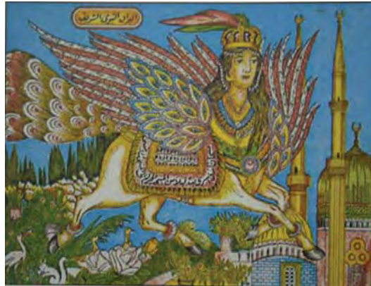
تصویر ۲۴- مصر، البراق نورالشریف، ۱۹۶۰، بدون رقم