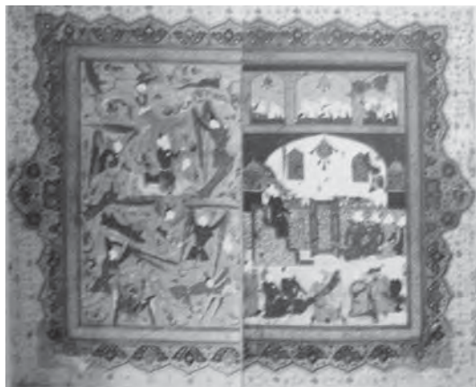
تصویر ۱۴- معراج، محمد زمان ۲۳/۵×۲۵ سانتی متر، قصص الانبیاء، ابراهیم ابن منصور نیشابوری