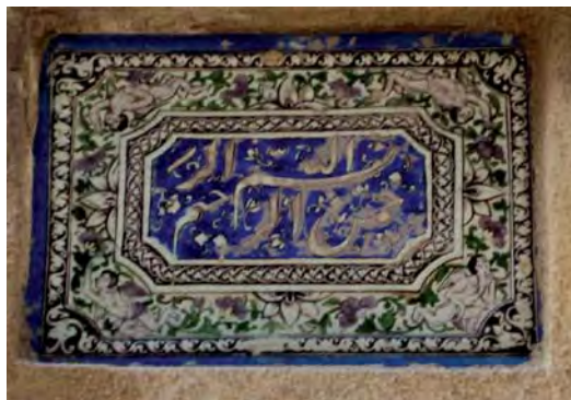
تصویر ۳- تهران، خیابان وحدت اسلامی، بازارچه ترخوانی (قوام الدوله)، کوچه طاهری

لذا کتیبه نگاران باید از دانش و آگاهی کافی در زمینه مساله هنری برخوردار باشند و کتیبه نویسی را امری مقدس و والا بشمارند. در دوره قاجار سازندگان کتیبه در مواردی خود، خوشنویس بوده و در اجرای خطوط نهایت دقت را به عمل می آوردند و یا متن و کلمه مورد نظر را از خوشنویس تهیه می کرده و بر روی زمینه مورد نظر انتقال می دادند.