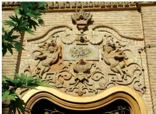
تصویر ۵- تهران، خیابان جمهوری، خیابان سی تیر، ماخذ تصویر: همان، بهار ۱۳۸۶

یکی از عوامل تاثیرگذار در روح مخاطب، نحوه خوشنویسی کتیبه است، در واقع یکی از عناصر تشکیل دهنده زیبایی ظاهری کتیبه و نیز آشکار کننده باطن آن خوشنویسی است و هر اندازه زیبایی آن در زمان ساخت کتیبه بیش تر رعایت شود، تاثیر آن بر بیننده افزوده می گردد. کتیبه دارای باطن و ظاهری است. ظاهر آن را کلمات نوشته شده و باطن آن را روح و مفهومی که در نهان کلمه نهفته است در بر می گیرد و هر چه خط نوشته شده دارای صفا و شان بیش تری باشد، در القای معنای باطنی کلمه موثرتر است و از آن جا که کتیبه نشان گر سبک و شکوه، عظمت و ابتکار هنری هر دوره ای محسوب می شود،