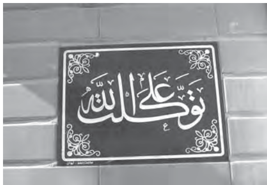
تصویر ۱۵- تهران، خیابان پانزده خرداد، کوچه شهید اکبرنژاد، بهار ۱۳۸۷