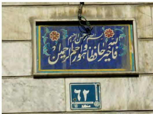
تصویر ۱۱- تهران، خیابان وحدت اسلامی، خیابان شهید جعفر اسدی منش، مأخذ تصویر: همان، بهار ۸۶

«معماری مدرن که در اواخر دوره رضا شاه به ایران راه یافته بود سبب گسترش جنبش مدرنیسم در تهران گردید و معماران از فرنگ برگشته نقش مهمی در اجرای معماری مدرن در سال‌های ۱۳۲۰ و بعد از آن داشتند و تا ۱۳۴۰ بسیاری از ساختمان‌های اداری و مسکونی با این سبک ساخته شدند.» (همان) با افزایش جمعیت و مهاجرت از روستا به شهر و با پیشرفت تاسیسات صنعتی، شهرها با بحران مسکن برای مهاجرین و ساکنان جدید مواجه شدند. معماری سنتی نتوانست پاسخ‌گویی رشد جمعیتی و اقتصادی باشد، در نتیجه معماران و طراحان به سوی معماری مدرن و معماری بین‌المللی گرایش پیدا کردند. از ۱۳۴۰ شمسی به بعد جمعیت تهران رشد بیش‌تری داشته و این روند همراه با رواج معماری سبک بین‌المللی بود. «سبک بین‌المللی شاخه‌ای از معماری سده بیستم که از ۱۹۲۰ در اروپای غربی پا گرفته و با ویژگی‌های یک دست و بدون توجه به شیوه‌های محلی و ملی و یا مصالح کار در اقلیم‌های مختلف رواج بین‌المللی یافته است. از خصوصیات بارز آن نظم و تعادل علمی، پاکی و سراسری سطوح و شکل بندی‌های مکعبی و راست خط و عاری از قرینه‌سازی است.» (مرزبان، ۱۳۷۷، ۱۶۵)