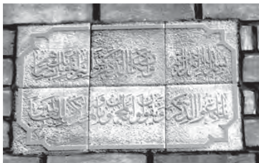
تصویر ۱۶- تهران، خیابان خیام، محله گذر مستوفی، کوچه مستوفی، بهار ۱۳۸۶، ماخذ تصویر: همان

در دو دهه اخیر با استفاده از آجرهای تزئینی که در نمای ساختمان های اداری و منازل مسکونی به کار گرفته شده، محیط شهری و نمای منازل از زیبایی خاصی برخوردار شده و سازندگان و استادان این فن توانسته اند جان تازه ای به چهره شهری ببخشند. هر چند در اوایل مهارت کافی نداشتند و آن ها را به صورت ساده نصب می کردند اما در سال های اخیر تنوع زیادی در نحوه تزئین نماها و کتیبه های سردر منازل دیده می شود. طول این