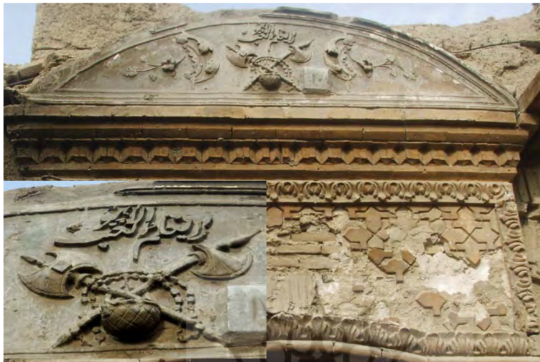
تصویر ۱- تهران، خیابان پامنار، کوچه شهید محمد طه اعلمی، بن بست اول، ماخذ تصویر: رضا محمدی، بهار ۸۶