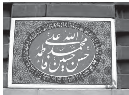
تصویر ۱۴- تهران، خیابان کارگر جنوبی، چهارراه لشکر، خیابان کمالی، کوچه غفاری، کوچه ملایری ماخذ تصویر: همان