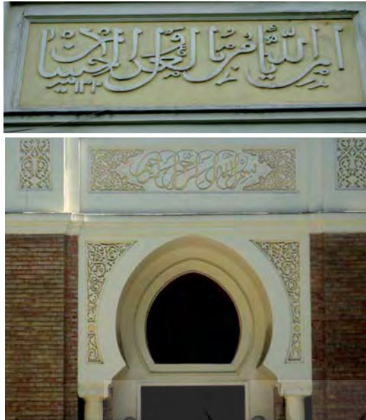
تصویر ۸- تهران، خیابان ولی عصر، بالاتراز تقاطع امام خمینی (ره)، فرهنگستان هنر

ورودی با برگ های کنگری قالبی تزیین و آرایش شده است. (تصویر ۵).