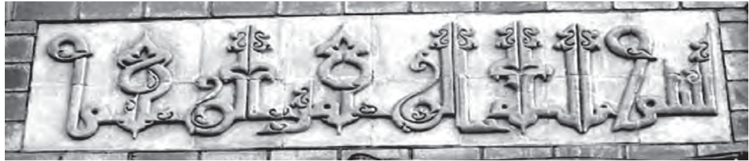
تصویر ۱۲- تهران، میدان بهارستان، ابتدای خیابان مجاهدین اسلام

ویژگی های خاص این نوع معماری تقریباً در بافت جدید شهری نشانی از عناصر ملی و سنتی وجود نداشت و کتیبه های سردر منازل در بافت جدید از بین رفته و تعداد اندکی که وجود داشت بسیار ساده و ابتدایی بودند. ب- با شروع جنگ تحمیلی، شهرهای بزرگ با مهاجرت آوارگان و جنگ زدگان مواجه شدند و در این زمان جمعیت شهرها و به ویژه تهران رو به افزایش نهاد و این ازدیاد جمعیت سبب ساخت و ساز بیش تر و توسعه محیط های شهری گردید و اغلب ساخت و سازها به دست استادان بنا ۱ و معمارانها افتاد و آنان از ارزش عناصر معماری سنتی آگاهی نداشته و نتوانستند از آن ها استفاده کنند در نتیجه بیش تر نماهای این گونه منازل بسیار ساده و بدون تزیین هستند و متأسفانه کتیبه هایی که بر سردر این منازل دیده می شوند از ارزش هنری و زیبایی شناسی کم تری نسبت به کتیبه های دوره های قبل برخوردارند و بیش تر از بعد اعتقادی دارای ارزش هستند. ج- وضعیت اقتصادی مردم از عوامل دیگری است که سبب کم رنگ شدن کتیبه ها شده است. گرانی مصالح ساختمانی مانند کاشی های سنتی (هفت رنگ، معرق و گره چینی)، انواع سنگ های تزیینی، آهن و آجرهای زینتی از یک طرف و هزینه زیاد ساخت و ساز و نصب آن ها از طرف دیگر باعث شده عامه مردم به کتیبه های ساده اکتفا کرده و برخی از آن ها حتی نمای منازل خود را نیز تزیین نکنند و به آویز کردن یک تابلوی چوبی و حلبی بر سردر منزل خود اکتفا کنند. در این بین نباید از عدم آگاهی سازندگان و استادان بنا غافل بود آن ها از پیشینه تاریخی کتیبه ها و