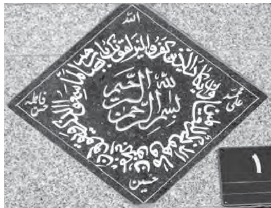
تصویر ۱۳- تهران، خیابان کارگر جنوبی، کوچه ژیان پناه، کوچه صداقت، زمستان ۸۷ ماخذ تصویر: همان

در دهه های اول انقلاب اسلامی روند نزولی ساخت کتیبه های سردر منازل که از دوره پهلوی آغاز شده بود، ادامه یافت و بسیاری از محتوای کتیبه های قدیمی از بین رفته یا به فراموشی سپرده شد. از عواملی که در این روند نقش موثری داشته می توان به موارد زیر اشاره کرد: الف- با ورود معماری غربی در دوره قبـل و