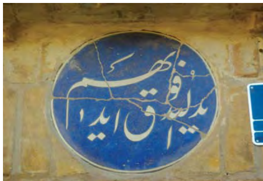
تصویر ۴- تهران، محله سرچشمه، خیابان شهید جاویدی، بن بست آقا عزیز، ماخذ تصویر: همان، بهار ۱۳۸۷