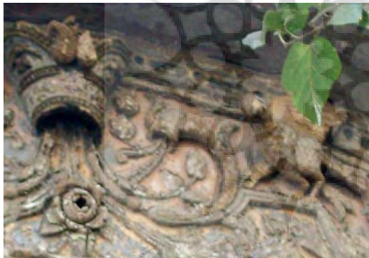
تصویر ۲- تهران، خیابان کارگر جنوبی، چهارراه لشگر، ابتدای خیابان کمالی، مآخذ تصویر: همان، بهار ۸۶

دورتا دور کتیبه با آجرهای پیش بر و با نقش برگ کنگری تزیین شده است.