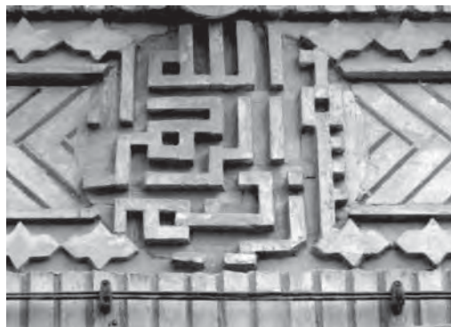
تصویر ۱۴- تهران، روبه روی خیابان اکباتان شرقی، زمستان ۸۷

و فقط دارای ارزش اعتقادی اند، با این وجود تنوع زیادی هم دارند. در میان کتیبه های سردرهای منازل امروزی آیه «و ان یکاد» بیش ترین آمار را به خود اختصاص داده است. ترکیب بندی و شکل نوشتاری این آیه به صورت خطی، دایره و نیم دایره است. تصویر ۱۳، کتیبه ای را نشان می دهد که شکل نوشتاری آیه به صورت دایره و کتیبه نیز به صورت لوزی در سردر نصب گردیده است. محتوای کتیبه های سنگی به کار رفته در سردر منازل این دوره آیات «نصر من الله و فتح قریب»، «آیت الکرسی»، «انا فتحنا لک فتحاً مبیناً»، «افوض امری الی الله» و حدیث حصن است و در میان کتیبه های اُسْمَاءِ مَتْبَرِکَه: صلوات، یا اَبوالفضل، یا حجه بن الحسن عسکری، امیری حسین و نعم الامیر، تصویر ائمه (امام رضا (ع) و یا قائم آل محمد وجود دارد.