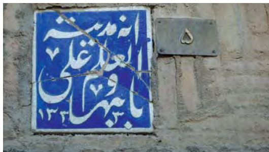
تصویر ۱۰- تهران، خیابان امیرکبیر، کوچه شهید جاویدی، کوچه شهید نیک پور (بی‌دل)، کوچه تقوی