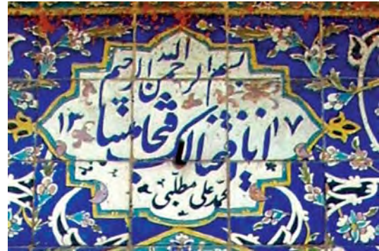
تصویر ۷- تهران، میدان بهارستان، خیابان مجاهدین اسلام، پاییز ۱۳۸۶

برخی از ورودی های منازل این دوره به صورت تلفیقی کار شده اند و می توان در آن ها علاوه بر معماری سنتی تأثیرات مدرن و جدید را مشاهده کرد. به عنوان مثال خانه پروفیسور عدل، دارای نمای روسی اما تزیینات ایرانی است، در واقع این ساختمان تلفیقی از معماری ایرانی و روسی است. قوس ورودی آن شبیه ورودی بناها در معماری شمال آفریقای می باشد. این قوس، ترکیبی از قوس بیزگلوبی دار