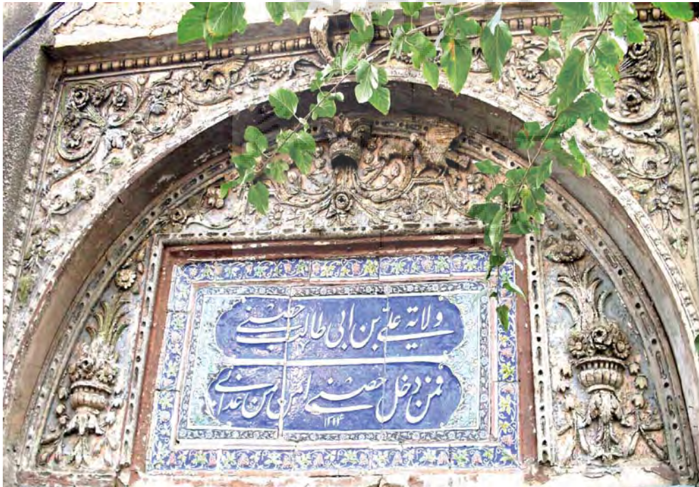
تهران، خیابان کارگر جنوبی، چهارراه لشکر، ابتدای خیابان کمالی، ماخذ عکس: رضا محمدی، بهار ۸۶