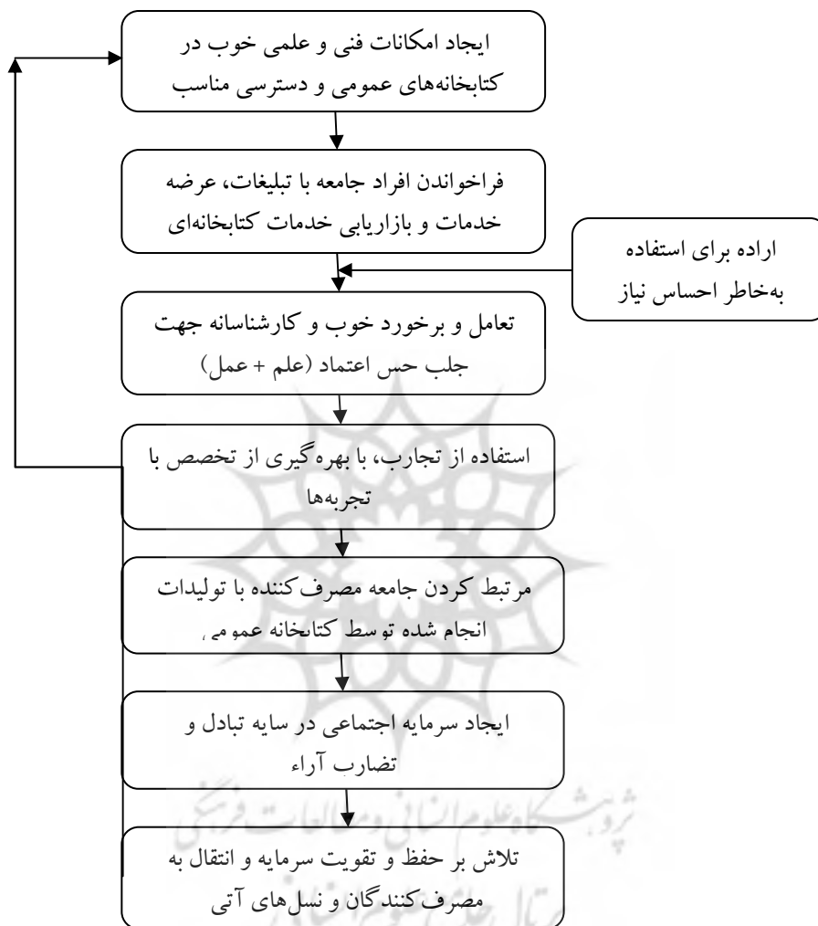
شکل ۳. چگونگی ایجاد سرمایه اجتماعی توسط کتابخانه‌های عمومی