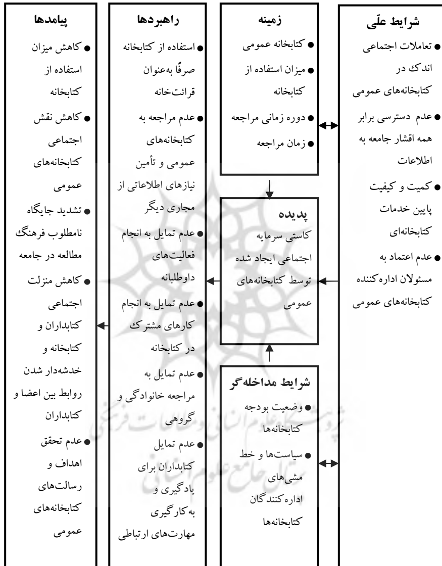
شکل ۲. مدل پارادایمی پدیده کاستی سرمایه اجتماعی ایجاد شده توسط کتابخانه‌های عمومی