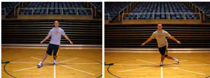
حالت تعادل در جهت قدامی - داخلی