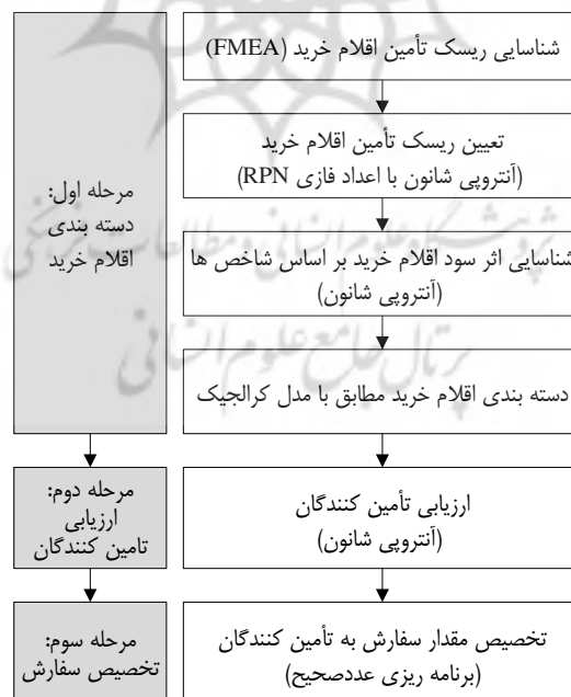
شکل ۲- رویکرد پیشنهادی برای تخصیص سفارش به تأمین کنندگان

استفاده از ابزار آنتروپی شانون وزن اهمیت نسبی آنها برآورد می شود. مطابق با مدل کراچیک و با استفاده از اوزان به دست آمده، اقلام خرید به چهار دسته استراتژیک، اهرمی، گلوگاهی و عادی دسته بندی می شوند. دسته بندی پیشنهادی به تصمیم گیران امکان اولویت بندی اقلام خرید را می دهد که می تواند به اتخاذ سیاست های متنوع و متناسب با ماهیت اقلام شود. در مرحله دوم، تأمین کنندگان با توجه به معیارهای در نظر گرفته شده توسط تیم تصمیم گیری کرده، با در نظر گرفتن ابعاد ریسک و اثر سود ارائه شده توسط کراچیک به منظور مدیریت موثر و کارای فرآیند خرید، تأمین کنندگان را به طور کیفی و با متغیرهای زبانی خیلی زیاد (V)، زیاد (H)، تقریباً زیاد (MH)، متوسط