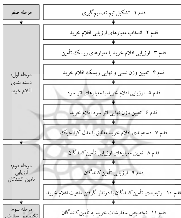
شکل ۳- روش پژوهش شامل دسته بندی اقلام خرید، ارزیابی تأمین‌کنندگان و تخصیص سفارشات

از قطعات مورد نیاز خود به صورت برون‌سپاری گرفته است. تعداد این اقلام ۱۰ عدد است و تخصیص سفارش این ۱۰ قلم، حوزه مورد بحث این مقاله است. به این منظور قدم‌های زیر پیشنهاد می‌شود (شکل ۳)