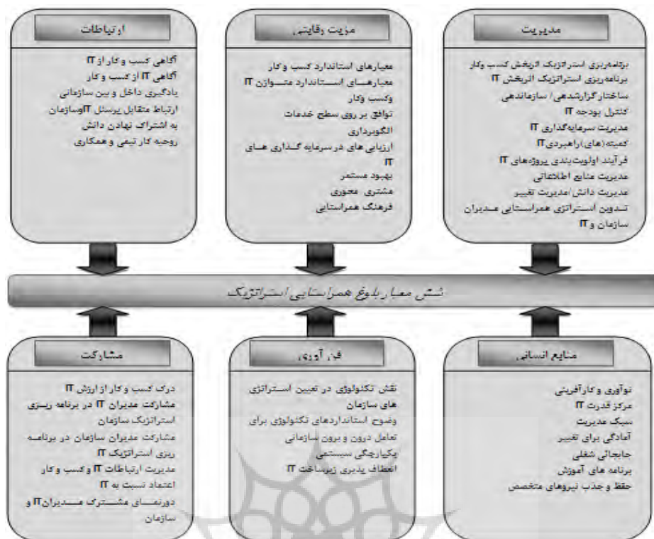
نمودار ۲- شاخص‌های مدل سنجش بلوغ همراستایی استراتژیک لوفتمن (لوفتمن، ۲۰۰۰)

۲-۳-۲- مدل بلوغ معماری سازمانی State of Oregon گردیده است. جدول ۳ ابعاد و شاخص‌های این مدل را نمایش می‌دهد.