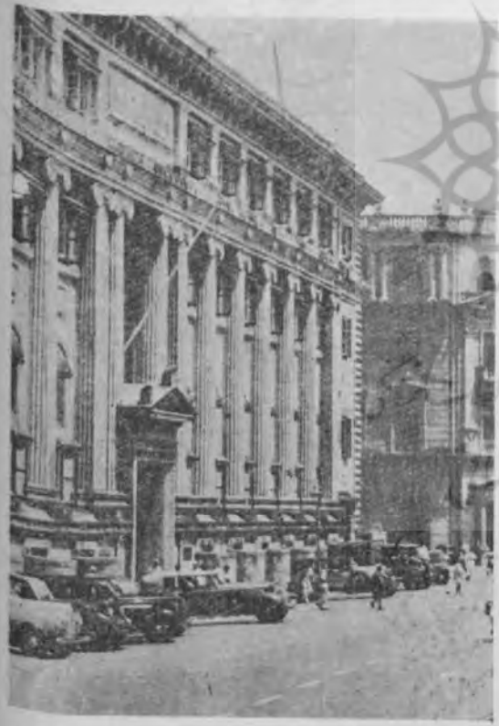
گوشه عمارت باشکوهی که شعبه بانک شامنشاهی هند را در آغوش دارد

بهر حال انفصال از مخلوق و اتصال به خالق و یا هرچه بود راه سرکوی دوست پیدا گردید . این اقامت بعنوان امامت نه تنها پرده بر ملامت ها کشید بلکه زنگ ملال از سیاهای کدر و خسته مرید و مراد زدود و هر دم بر جلوه و جلال این خاندان نامی بيفزود و این افزایش از حد متعارف گذشته به نقطه رسید که تاریخ روحانیت تا کنون نظیر آنرا نشان نداده و آن توزین سومین خلف جانشین وی سلطان محمد شاه آقا خان فعلی با بریانت بود که در ۱۰ مارس جاری ۱۹۴۶