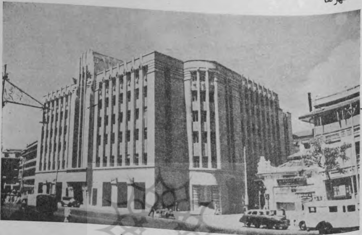
عمارت بنگاه بیمه هند جدید در بمبئی

دل اسیر حلقه زنجیر هند جان فدای خاک دامنگیر هند ملک الشعرا بها