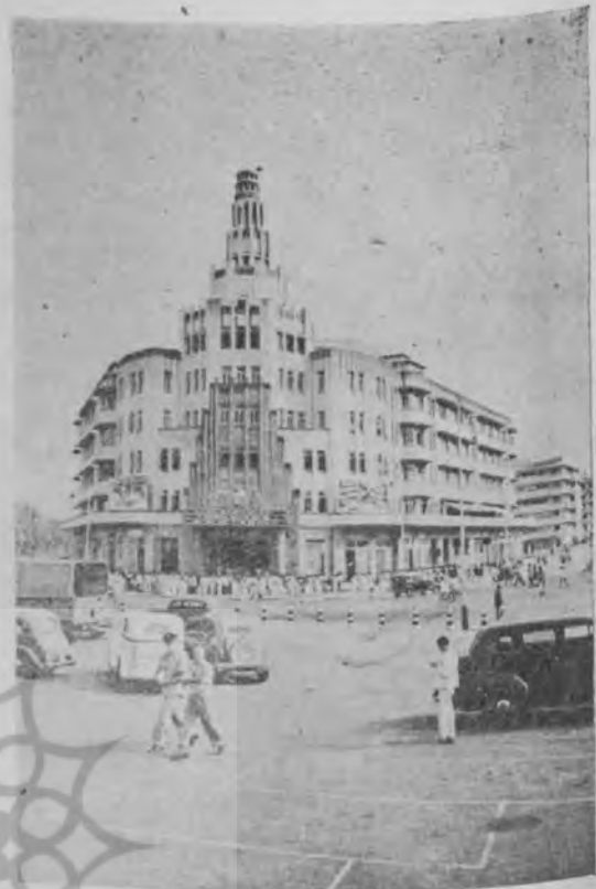
منظره عمارت یکی از سینما های مهم بمبئی

«روز پنجشنبه ۲۶ شهر رمضان المبارک ۱۶۰ از کراچی براه دریا جهت سرکشی جماعت مریدین متوطنین ملک کهچ و بهوج حرکت کردم تا آنجا که مینویسد «و محرم ۱۲۶۱ را در جام نگر برسوم تعزیه داری جناب ابا عبد الله سلام الله علیه پرداخته و مطابق یکسال در ملک «کایاوار» و «هالار» و اضلاع آن مختصراً سرکشی از جماعت آن صفحات نموده و از بندر سورت بطرف دکن روانه و محرم ۱۲۶۲ بعد از انعام لوازم تعزیه داری در اواخر شهر صفر مذکور بعزیمت بمبئی حرکت و بعد از ورود به بندر معموره مذکور حمد خدای متعال و نعت اجساد بزرگوار از دم الی خاتم انبیاء و آل او از ماضی تا حال بجا آوردم و الحمد لله تعالی صمداً دائماً ازلیاً ابدیاً که این درویش امکان نژاد منسوب متصل نمره شجره طیبه مشهوره مشهوره و بقیه مستوره ظاهره را در بین دیر خرابه آباد از خلوتخانه عدم بتجلیسات وقایع مضمنه طی ازمنه آهنگ - ۹