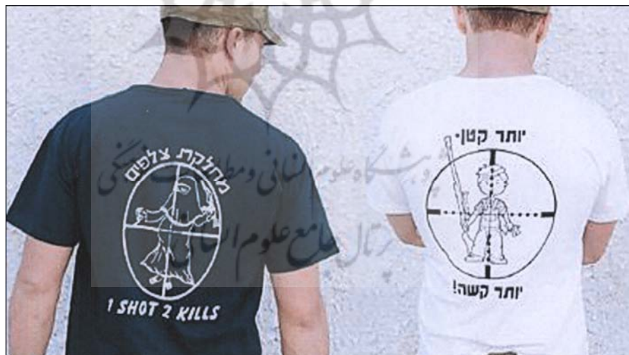
یک گلوله دو کشته:

یهودیان در سر زمینهای اشغالی فلسطین با تبلیغ کشتن زنان مسلمان بار بار به دو هدف می‌رسند.