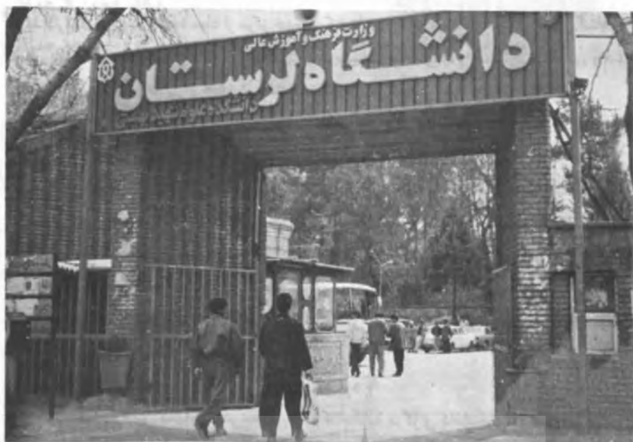
نمای ورودی دانشگاه لرستان