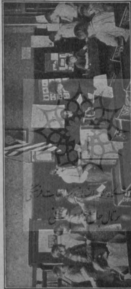
بچه ها در زیر پرچم ملی را بجا می خورند و در اینجا است مدرسه بصندوق میاندازند. "Volin", Under the Flag at the School Election.

۱۹ — در مدرسه جدید در عرض ماه یا فصول سال، رشته های متعدد کمتر تدریس می شود. ترتیب پروگرام شبیه به پروگرام دارالفنونهاست — هر شاگرد برای خود ساعات معینی دارد که در