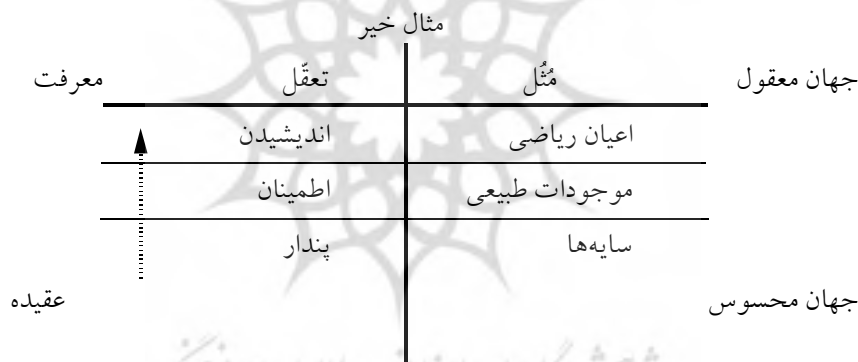
نمودار (۲): جایگاه روش‌شناسی در نظام هستی‌شناختی - معرفت‌شناختی افلاطون (۱۶)

نمودار شماره دو نیز جایگاه روش‌شناسی افلاطون را در نظام معرفت‌شناختی او، که بر اساس تمثیل خط آمده، به صورت نقطه‌چین نشان داده است: