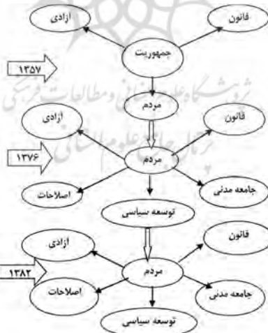
نمودار تحول نظام معنایی گفتمان اصلاح طلب ۱۳۵۷-۱۳۸۲ ۵۹

گفتمان می‌تواند تحولات و تغییرات در درون نظام معنایی خود در قبال گفتمان رقیب را و سیر تاریخی این تحولات را نشان دهد. گفتمان اصلاحات نیز مشمول این فرایند تحول شده با تغییر در دال مرکزی و دال‌های پیرامونی خود به ایجاد نظام معنایی جدیدی در مقابل گفتمان رقیب دست یازید.