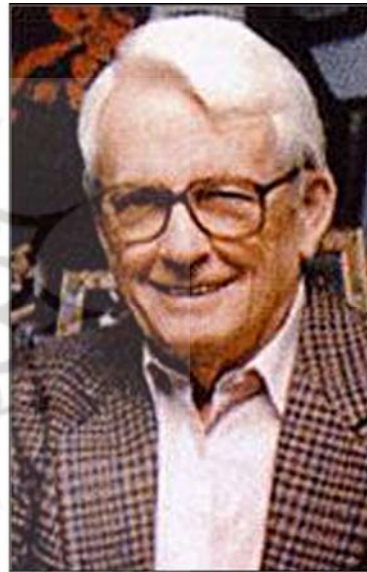
پل فیندلی نویسنده کتاب «فریب‌های عمدی»

رئیس کارکنان کاخ سفید نقش مهمی در نظارت بر عملکرد تیم (کارکنان) کاخ سفید دارد. وی همچنین می‌تواند درباره دستیابی رئیس جمهور به اطلاعات و توصیه‌هایی که برای اتخاذ تصمیمات لازم به آن نیاز دارد، نظر دهد. وی کسی است که درباره برنامه کاری مربوط به فعالیت‌های مختلف رئیس جمهور، نظر می‌دهد. گفتنی است که «رام امانوئل» سومین یهودی