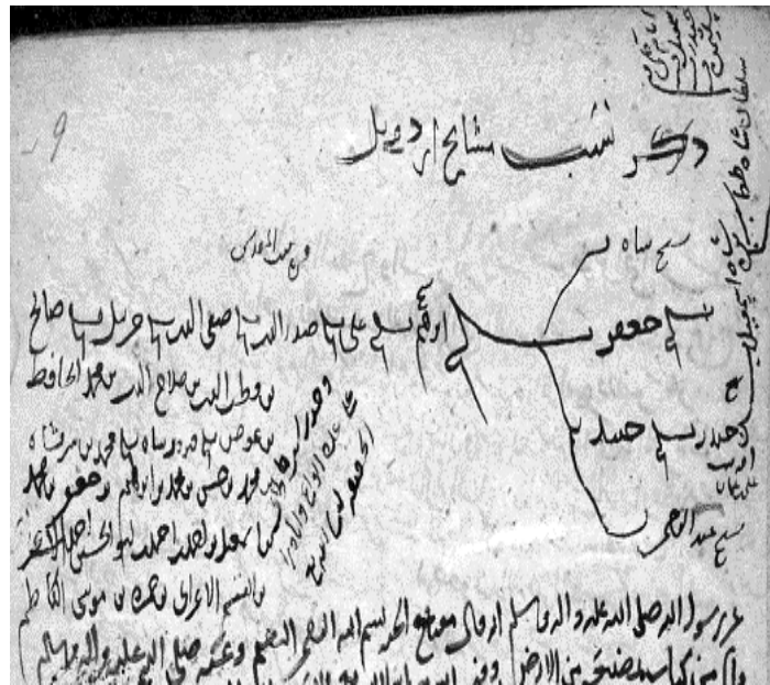
منبع: نسخه کتابخانه بریتانیا، ش ۱۴۰۶، ۹ الف.

بنابراین، با احتیاط می‌توان گفت که نسخه شماره ۱۴۰۶ در ربع سوم قرن پانزدهم میلادی حوالی یا کمی بعد از سال‌های ۸۶۵ق/۱۴۶۰-۱م و ۸۶۸ق/۱۴۶۳ که در نسخه آمده، تدوین شده است. نیمه دوم دهه ۸۶۰ق / نیمه اول دهه م ۱۴۶۰ به احتمال زیاد دوره‌ای است که در آن، نسخه تدوین شده است، زیرا تمام تاریخ‌های ذکر شده توسط الموسوی النجفی بین این دو تاریخ قرار می‌گیرد و بنابر این، نمودار شجره‌ای این نسخه، یعنی ذکر نسب مشایخ اردبیل باید همین تاریخ را داشته باشد. نمودار را می‌توان به سه بخش تقسیم کرد: ۱. شجره‌نامه اصلی؛ ۲. توضیح در مورد شجره‌نامه، و ۳. آن بخشی از شجره‌نامه که به خط دیگری بعداً اضافه شده است.