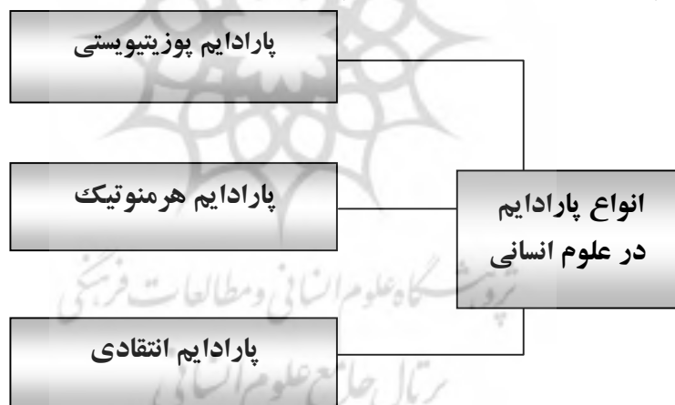
شکل (۱) انواع پارادایم در علوم انسانی

برخی پژوهشگران مانند اریکوسکی و برودی ۲۹ و چوا ۳۰ با نظر به مفروض های معرفت شناختی، سه طبقه از پارادایم ها را معرفی می کنند که عبارت اند از: اثبات گرایی، تفسیری و انتقادی. ۳۱ هر یک از این رویکردها به تعبیر کوهن با پارادایم ۳۲ مشخص شده اند. همچنین کوهن بر این باور است که در هر زمانی، یکی از پارادایم ها بر جامعه علمی حاکم می باشد. منظور از پارادایم، دستاوردهای علمی مورد پذیرش همگانی است که برای یک دوره زمانی، الگوها، مسائل و راه حل ها را برای جامعه ای از کارورزان فراهم می آورند. ۳۳ همچنین پارادایم مشتمل است بر مفروضات کلی نظری، و قوانین و فنون کاربرد آنها که اعضای جامعه علمی خاصی آنها را دربر می گیرند. در واقع پارادایم، فعالیت دانشمندان عادی را که سرگرم گشودن و حل معماها هستند، هماهنگ و هدایت می کند. ۳۴ سه پارادایم در علوم انسانی وجود دارد که شامل پارادایم پوزیتیویستی ۳۵ (اثبات گرایی)، پارادایم هرمنوتیک ۳۶ یا تفسیری و پارادایم انتقادی ۳۷ می باشد. ۳۸