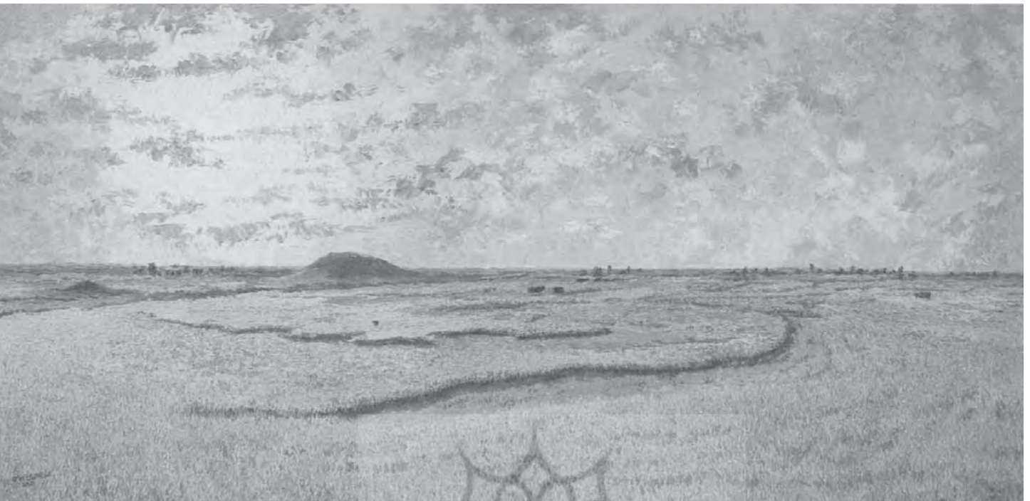
محمد جوادی پور، بامداد صحرا، رنگ روغن روی بوم، ۱۳۷۱، ۱۲۲×۶۱ cm

تابلوهای موسوم به «کویر» که شامل ۸ تابلو می‌شود از آثار جلال شباهنگی استاد دانشگاه تهران است که نگاه‌های مختلف نقاش به جلوه‌های زیبای کویر و چشم‌اندازهای گوناگون آن را دربرمی‌گیرد. شماری از تابلوهای موزه که مربوط به آثار افشین هاشمی، مسعود عربشاهی، فریده لاشایی و دیگران می‌شود تابلوهای بدون عنوان هستند که راه را برای ارتباط بیننده باز و آزاد گذاشته‌اند؛ به عبارتی ایجاد کنندگان اثر ترجیح داده‌اند که تفسیر آثارشان را به مخاطبان خود واگذار کنند.