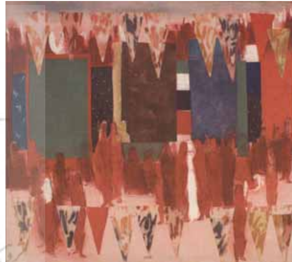
آنه محمدناتاری، بدون عنوان، ترکیب مواد روی پارچه، ۸۶×۹۵