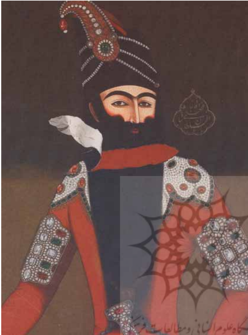
آیدین آغداشلو، خاطرات انهدام، گواش روی مقوا، ۵۶×۵۷، ۱۳۸۷

و هنرستان، حافظه بصری خود را با تماشای آثار چند نسل از نقاشان و اهل نقاشی خط پرورش دهند.