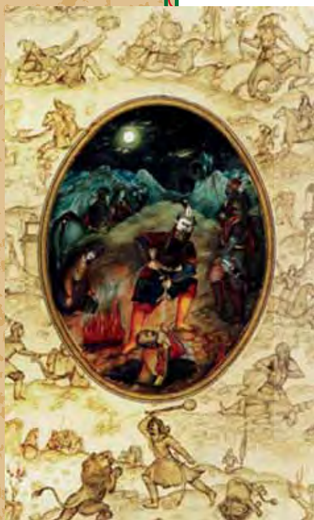
۷. رستم و بیرون آوردن بیژن از چاه، اثر ابوطالب مقیمی، ۱۳۱۵ شمسی