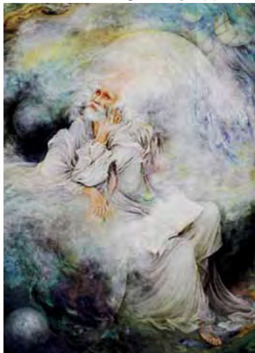
۸. حافظ، اثر فرشچیان، ۱۳۷۴ شمسی