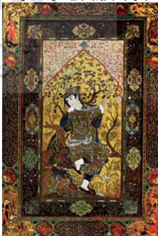
۳. بوستان، سوخت و معرق چرم، اثر میرزا آقاسی، ۱۳۰۵ شمسی

بهباد نوعی حرکت و پویایی با رنگ‌بندی محدود را در نگارگری نشان می‌داده است. خطوط