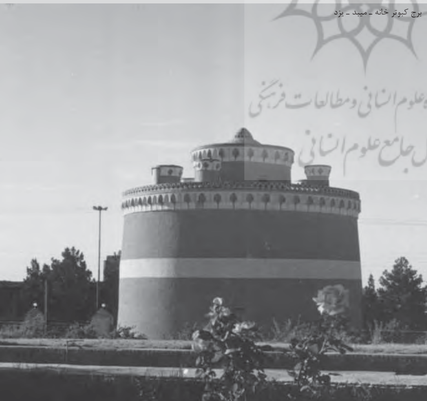
برج کبوتر خانه - میبد - یزد

در گذشته تعداد بسیاری از این برج‌ها در اطراف اصفهان و دیگر شهرها وجود داشته و همگی دارای رونق و حیات بوده‌اند. به‌طوری‌که شاردن، سیاح معروف فرانسوی، در سفرنامه خود تعداد برج‌ها را در دوران