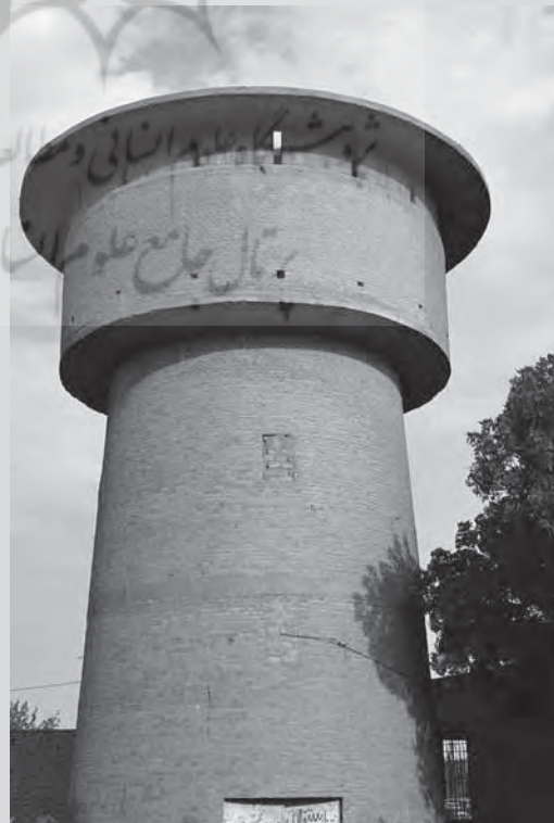
برج کبوترخانه - سرخس - خراسان رضوی

کالبد اصلی برج از لحاظ شکل و کارکرد خود، با