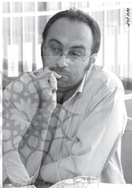
بهر روز ثروتی

بهر روز ثروتی: منظور من این است که دانش آموز آرایه‌ها را متوجه می‌شود و ولی ممکن است بپرسد که ما برای چه به این می‌گوییم آرایه؟ من خودم از متن‌های مختلف هم شاهد آورده و خواسته‌ام