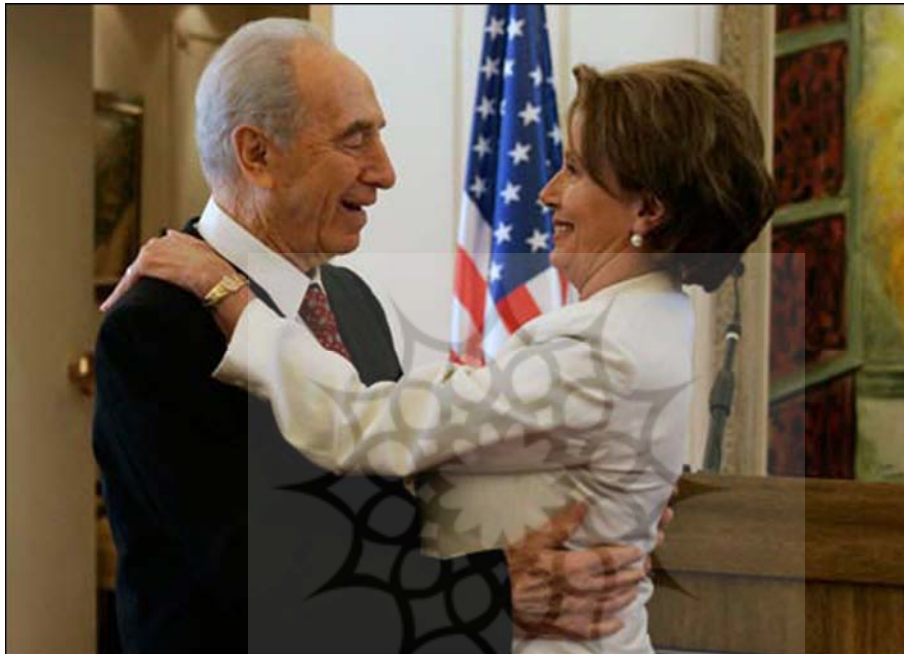
نانسی پلوسی و شیمون پرز

قلب‌های مردم لبنان را از تمام فرقه‌ها از آن خود کرد و نشان داد که بیش از همه در اندیشه ثبات و امنیت در پی رهایی از هرگونه اشغال‌گری است. این امر در خلال جشن‌های ۶۰ سالگی اشغال، ضربه بسیار مهلکی به صهیونیسم وارد کرد.