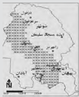
نقشه ۳. پهنه گرم و خشک

سردترین و گرم‌ترین روزهای سال بین ۱۳ تا ۳۴ درجه سانتی‌گراد در نوسان است