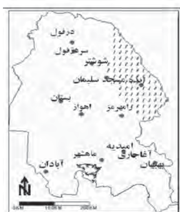
نقشه ۵. پر بارش