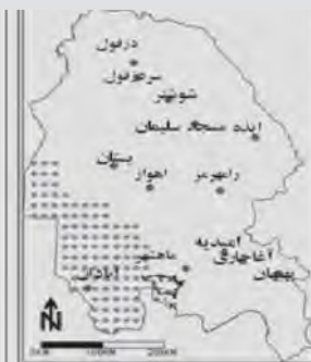
نقشه ۲. پهنه مرطوب و کم‌بارش