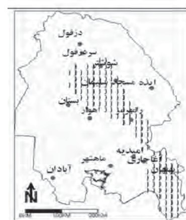
نقشه ۴. پهنه مرطوب و معتدل