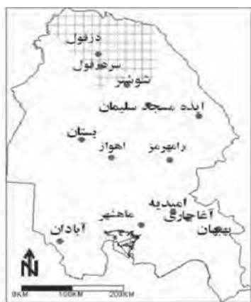
نقشه ۶. پهنه اقلیمی معتدل و بارش مند