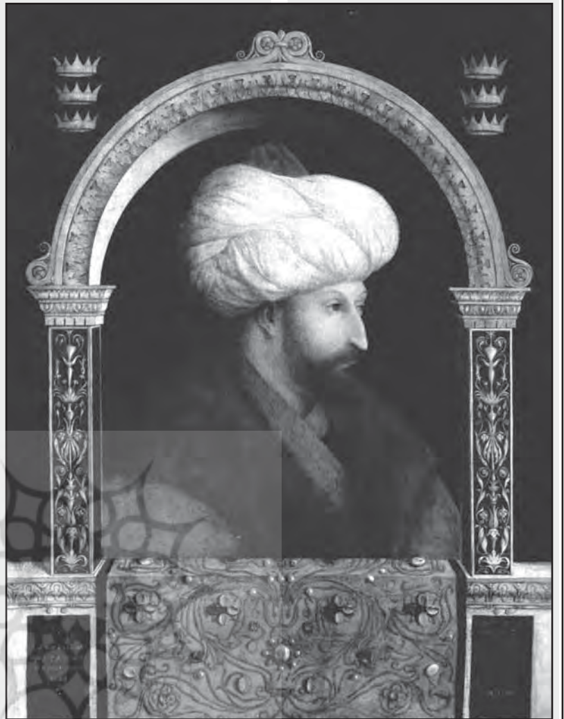
سلطان محمد فاتح

امیرنشین مستقل آناتولی بودند که هنوز در دولت عثمانی مقاومت می کردند. سرزمین قرامانیان از آنجا که به دریای مدیترانه مشرف بود، با اروپای غربی به ویژه با ونیز که بر قبرس چیره شده بود، روابطی فعال داشتند [مینورسکی، ۱۳۵۱: ۱۷۲].