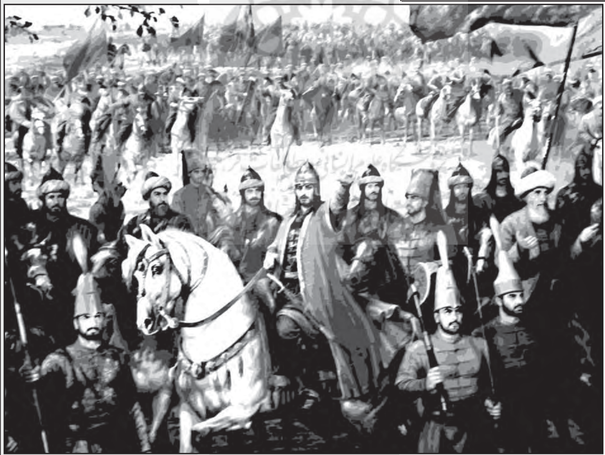
سلطان محمد فاتح در میدان نبرد

نکتهٔ قابل تأمل این‌که اوزون‌حسن سعی کرد همان نقش تیمورلنگ را تقریباً بعد از یک قرن بازی کند؛ یعنی کمک به احیای امیرنشین‌های آناتولی. دولت قرامان از آن‌جا که سر راه اوزون‌حسن و دولت ونیز بود، می‌توانست نقش ویژه‌ای