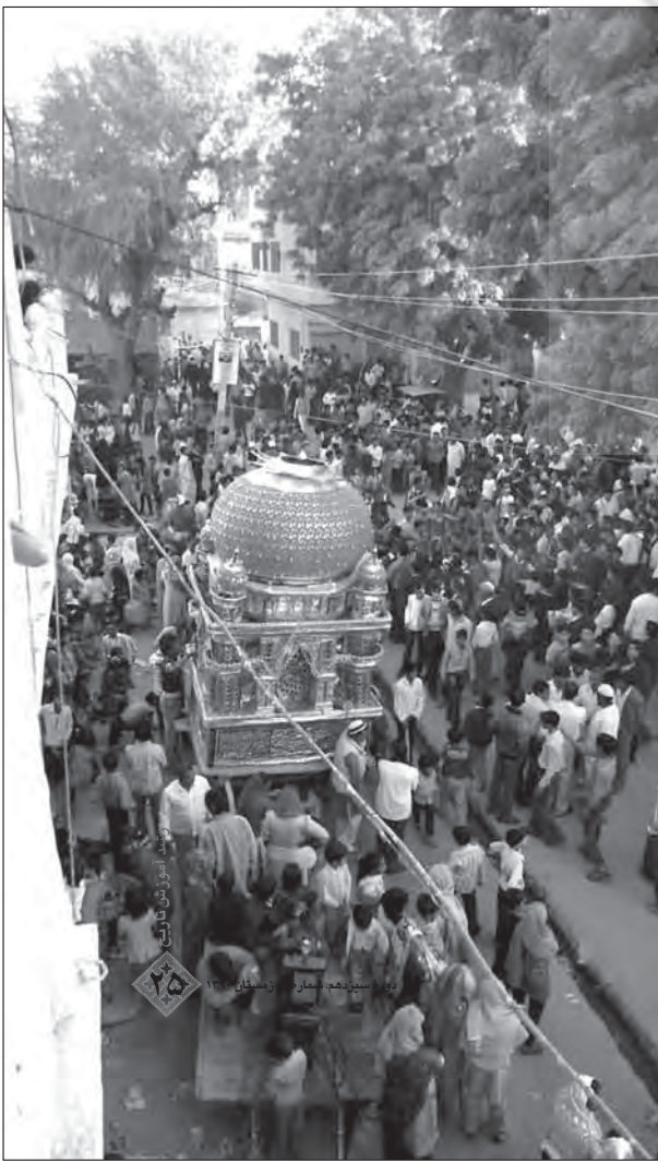
عاشورا در شبه‌قاره هند

با رونق گرفتن مرادفات تجاری حکام مسلمان هند با جنوب شرقی آسیا، به‌ویژه بندرهای جنوبی چین و هم‌چنین بنادر پر رونق آیوتایا، تناسری و ملاکا در تایلند، برمه و مالزی، سلطه حاکمان سنی‌مذهب بر جنوب هند و بروز ناآرامی‌های سیاسی در «دکن» و دیگر نواحی جنوب هند، و هم‌چنین، به‌دست آوردن موقعیت‌های مناسب تجاری و اقتصادی و گسترش نفوذ کارگزاران ایرانی در دربارهای پادشاهان محلی در برمه، سیام و آچه، تعداد زیادی از این گروه از ایرانیان به خانه‌های اصلی خود در هند و ایران برنگشتند برای همیشه