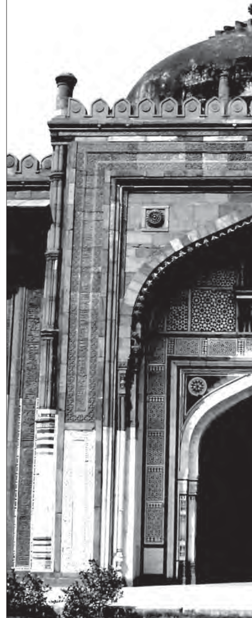
مسجدی در پورانا، هند

جنبه اصلی دیگری که از هند وارد منطقه شد و مورد توجه و علاقه سلاطین و حکام محلی قرار گرفت، برخی آموزه‌های صوفیانه و عرفانی به‌ویژه ایده «انسان کامل» و «نظام ولایت»، برگرفته از آثار ابن عربی بود