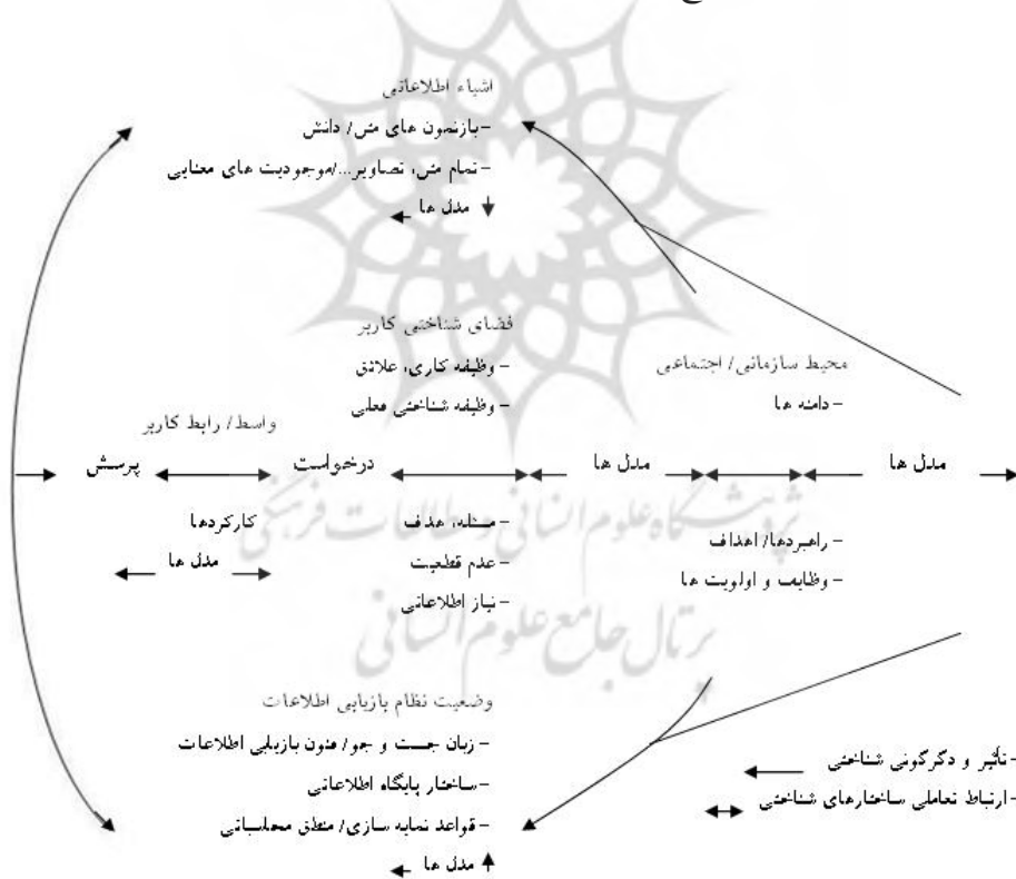
شکل ۲. مدل شناختی اینگورسن از تعامل در بازیابی اطلاعات (Jarvelin and Wilson 2003)

در این مدل، کاربران به عنوان ساختارهایی شناختی درون یک فضای اطلاعاتی انگاشته شده‌اند که در حال تعامل با "متن" (به معنی عام کلمه) یا اشیاء اطلاعاتی هستند. زمینه‌های موقعیتی و شناختی کاربر از اجزاء اصلی به کاررفته در این مدل هستند (Ingwersen 1992). ساراسویک بیان می‌دارد که نقطه ضعف مدل اینگورسن، در عدم ارائه امکان آزمون‌پذیری این مدل است که این مسأله به‌خصوص در کاربرد آن برای ارزیابی نظام، نمود بیشتری پیدا می‌کند. علاوه بر آن، نقطه ضعف اصلی این مدل در عدم تجزیه و تحلیل رفتار اطلاع‌یابی به گونه‌ای صریح و مجزا از بازیابی اطلاعات است. مسائلی از قبیل چگونگی جستجوی کاربران و همچنین، چگونگی تأثیرپذیری ساختارهای شناختی کاربران از فرایندهای جستجوی اطلاعات، می‌تواند با عناوین محیط اجتماعی یا سازمانی درون این مدل مطرح شوند، اما در این مدل به‌طور صریح به آنها پرداخته نشده است (Ingwersen 1996).