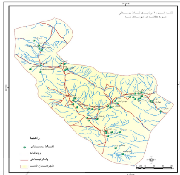
شکل ۳: نقشه پراکنندگی نقاط روستایی در محدوده‌ی تقسیمات سیاسی شهرستان فسا مأخذ: نگارندگان

د- تعیین وزن و درجه اهمیت خصوصیت‌ها: برای بیان اهمیت نسبی خصوصیت‌ها و معیارها باید وزن نسبی آنها را تعیین کرد. در این زمینه روش‌های متعددی مانند Linmap، AHP، ANP، آنتروپی شانون، بردار ویژه و مانند آن وجود دارند که متناسب با نیاز می‌توان آنها را مورد استفاده قرار داد. در این تحقیق از روش ANP برای تعیین وزن شاخص‌ها استفاده شده است.