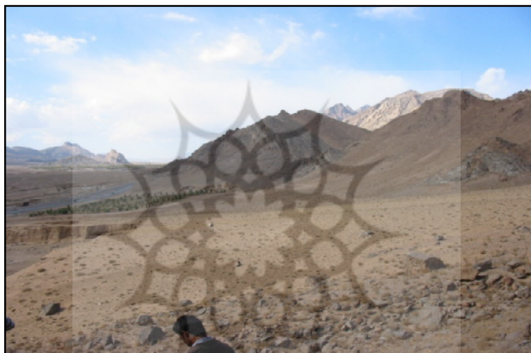
شکل ۳: کوهریگ فراشاه (تفت) در ۱۷ کیلومتری جنوب یزد. نگاه به سمت غرب. سطح کوهریگ از پوشش بوته‌ای و مواد واریزه‌ای پوشیده شده است. در قسمت پایین (سمت چپ شکل) برداشت جهت مصالح ساختمانی انجام شده است.

پدیده‌ی کوهریگ در اکثر بیابان‌های ایران به دلیل فعالیت‌های زمین‌ساختی و با توجه به رشته‌کوه‌ها یا کوه‌های منفرد باقی مانده از این فعالیت‌ها دیده می‌شود. کوهریگ‌ها، بسته به اینکه در چه موقعیت مکانی متراکم شده‌اند، از حداقل شیب (کمتر از ده درجه) تا حداکثر شیب مربوط به تراکم‌های ماسه‌ای (حدود ۳۵ درجه) را در بر می‌گیرند (مهرشاهی، ۲۰۰۱). ضخامت کوهریگ‌های بررسی شده در نقاط مختلف استان یزد از بیش از سی متر (شمال شرقی اردکان) تا حدود ۱۲ متر (حوالی فراشاه تفت، یزد شکل سه) و کمتر تغییر می‌کند (مطالعات شخصی). در این قسمت به نتایج مطالعاتی که در بخش‌هایی از استان یزد صورت گرفته است، اشاره می‌شود.