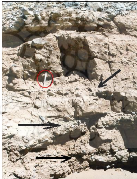
شکل ۴: مقطعی از بخش پایینی کوهریگ اصلی ۲۰ کیلومتری شرق اردکان (کوهریگ حوض سفید). پیکان‌ها لایه‌های آبرفتی را نشان می‌دهند. سطح کوهریگ کاملاً از واریزه پوشیده شده است. خودکار درون دایره به عنوان مقیاس است.

در حد ماسه بوده‌اند، موجب تغذیه‌ی حجم متنابهی از رسوبات ماسه‌ای در یک دوره یا دوره-های متعدد شده است که زمان آن به جز یک مورد بر ما روشن نیست. در این منطقه (کویر اردکان) بزرگ‌ترین کوهریگ یافت شده، تحت عنوان کوهریگ اصلی نزدیک معدن حوض سفید، مابین دشتی به ارتفاع تقریبی ۱۱۰۰ متر در فاصله ۱۸ کیلومتری شمال شرقی شهر اردکان و یکی از کوه‌های جدا افتاده از رشته خرائق به ارتفاع حداکثر ۱۸۶۵ متر (از سطح دریا) در دره‌ای که زین اسبی دارد متراکم شده است. مطالعه‌ی یک مقطع از این کوهریگ که توسط سیلاب بریده شده است، نشان داد که در این مقطع، حداقل ۲۵ متر از تناوبی از لایه‌های ماسه بادی، لایه‌های آبشسته دامنه‌ای و رسوبات واریزه‌ای عناصر تشکیل‌دهنده‌ی اصلی هستند (شکل چهار). طرز استقرار و شکل تراکم این کوهریگ در دو سوی تک کوه مذکور نشان می‌داد که ذرات ماسه‌ای در مدتی احتمالاً طولانی از سمت جنوب- جنوب شرقی آورده شده و به سمت مقابل رانده شده بودند به طوری که اختلاف ارتفاع پس‌ترین بخش کوهریگ (از کمتر از ۱۲۵۰ متری) و بلندترین بخش آن (در ارتفاع حدود ۱۳۶۰ متری) به بیش از یک صد متر می‌رسید (مهرشاهی و همکاران، ۱۳۷۷).