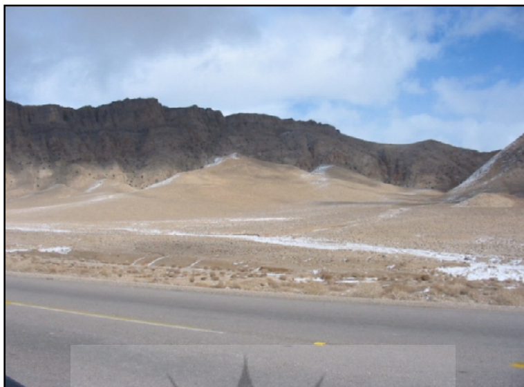
شکل ۱: نمونه‌ای از تراکم کوهریگ در دامنه کوه تنگ حوضکی یزد (جاده مهریز-ارنان) جنوب یزد. جهت حرکت کوهریگ از جنوب به شمال. سطح کوهریگ از پوشش گیاهی بوته‌ای انبوه و واریزه پراکنده پوشیده شده است.

هدف اصلی این مقاله، معرفی این پدیده، بررسی ویژگی‌های رسوب‌شناسی و موقعیت استقرار کوهریگ‌ها، نگاهی به بخشی از مطالعات انجام شده در این مورد در جهان و منطقه و نیز شناخت اهمیت مطالعه‌ی کوهریگ‌های ایران است. در واقع این مقاله سعی دارد تا بحثی و زمینه‌ای را تحت عنوان " کوهریگ‌شناسی " در ایران باز نماید. از آنجا که این نوشتار برای آشنایی علاقمندان به جغرافیای طبیعی ایران، به ویژه دانشجویان کارشناسی و کارشناسی ارشد و اساتید محترم، تهیه شده است، از بخش‌بندی و ساختار ویژه‌ی مناسب با این نوع مقالات بهره می‌برد.