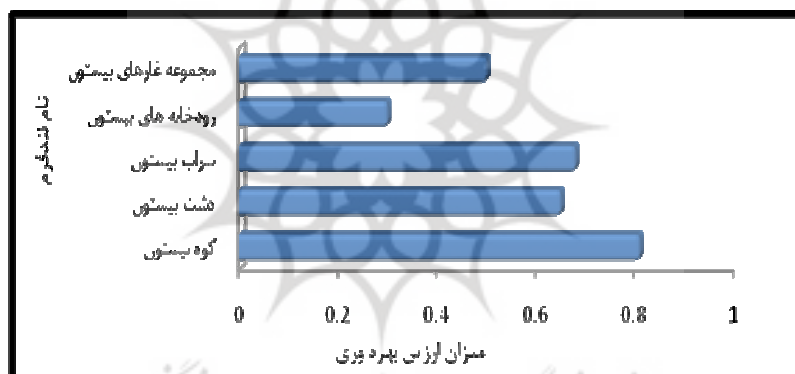
شکل (۳) مقایسه ارزش بهره‌وری لندفرم های ژئومورفولوژیکی منطقه نمونه گردشگری بیستون

ولی تغییرات روند ارزش زیبای ظاهری رابطه کمتری با دیگر ارزشها داشته است. به عبارتی ارزش زیبایی ظاهری در همه لندفرم های منطقه نمونه گردشگری بیستون مشاهده می‌گردد و در کوه بیستون ارزش زیبای ظاهری به اوج خود می‌رسد به طوری که ملاحظه می‌گردد بیشترین ارزشهای گردشگری مربوط به کوه بیستون و کمترین ارزشها در روخانه‌های (گاماسیاب و دینور آب) مشاهده می‌شود که با توجه به پتانسیل بالای رودخانه‌های منطقه در زمینه گردشگری از آنها باید بهره‌برداری شود. بر این اساس میزان ارزش بهروری از لندفرم های منطقه به ترتیب در کوه بیستون به علت بالا بودن ارزشهای گردشگری بالاتر از دیگر لندفرم‌ها می‌باشد و بعد از آن سراب بیستون، دشت بیستون، مجموعه غارهای بیستون و رودخانه‌های بیستون قرار گرفته اند که در برنامه ریزی‌های گردشگری باید به آنها توجه گردد (شکل ۳).