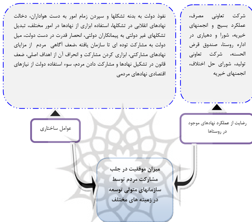
شکل (۲) مدل تحلیلی متغیرهای تحقیق یافته‌های پژوهش، ۱۳۹۰

بررسی تشکلهای و نهادهای محلی در منطقه: تشکلهای و نهادهای محلی مورد مطالعه عبارتند از: (۱) نهادهای مدیریتی- نهادهای مدیریتی امور روستاها بر عهده شوراهای روستایی و دهیارها هستند. در روستاهای تحت مطالعه از نظر کمی ۱۰۰ درصد آبادیها دارای دهیاری بودند. بررسیهای انجام یافته در خصوص کیفیت عملکردی دهیاری روستاهای منطقه، نشان می دهد که مردم از عملکرد دهیارها رضایت کافی را نداشتند. میزان رضایتمندی از دهیارها در منطقه (۲/۴) در مقیاس لیکرت کمتر از حد متوسط است. بر اساس اظهارات مردم، عوامل اصلی عدم رضایتمندی مردم از عملکرد دهیارها، سوی گیری این تشکلهای به نفع شخصی و آشنایان سببی و نسبی است.