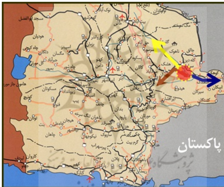
شکل (۲) نمایی از محورهای اصلی منطقه نمونه گردشگری کلپورگان با نواحی پیرامونی