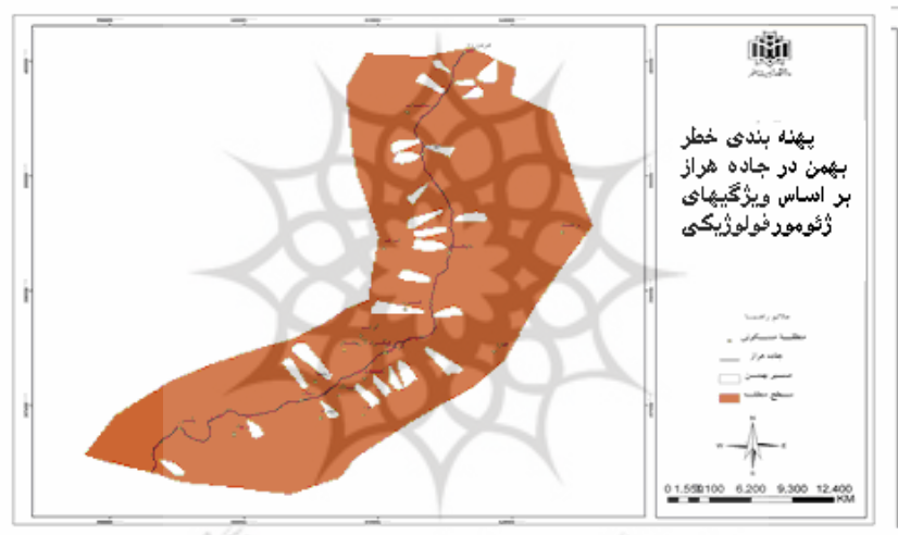
شکل شماره ۲ نقاط بهمن خیز مسلط بر جاده هراز (امام زاده هاشم تا هردورد

این نقشه را با استفاده از بازدیدهای میدانی و برداشت حدود ده نقطه توسط GPS از جاهایی که با توجه به معیارهای ژئومورفولوژیکی، اقلیمی، و شواهدی مبنی بر وجود تونل‌ها و بهمن‌گیرهای موجود، احتمال وقوع بهمن وجود داشت تهیه کرده‌ایم (شکل شماره ۲).