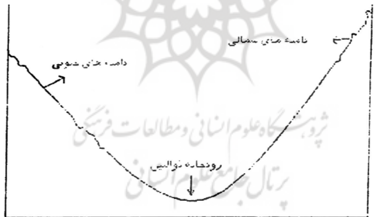
شکل ۳- نیمرخ عرضی جهات مختلف دامنه‌ها در دشت مرند

را با یک ماه تاخیر در پهنه‌های مرتفع‌تر همراه می‌کند. سرعت کاهش دما با ارتفاع، عموماً با افزایش میزان ابرناکی کاهش می‌یابد. (رجایی، ص ۴۸) دره‌ها معمولاً منبع تجمع هوای سرد در شب قلمداد می‌شود و از پهنه‌هایی است که اغلب وارونگی دما در آنجا یافت می‌شود و باد کمتر می‌تواند شرایط اعتدال هوا را در آنجا فراهم کند، دامنه‌های شمالی برف بیشتری را به نسبت دامنه‌های جنوبی در خود جای می‌دهد. دامنه‌های جنوبی در بهار به سرعت گرم می‌شود، در حالی که دامنه‌های شمالی سرد باقی می‌ماند. اختلاف دما طی روزهای گرم بهاری بین شیب‌های شمالی و جنوبی به 20^{\circ}\text{C} می‌رسد (شکل ۳). آنچه که اهمیت دارد نزول هوای سرد در دامنه شمالی کوه‌ها به دره رودخانه ذوالبین است.