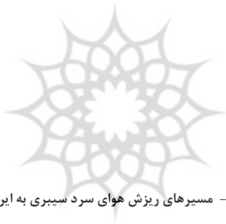
شکل ۴ - مسیرهای ریزش هوای سرد سیبری به ایران

۳. جهت سامانه‌های یخبندان عمدتاً شمال غربی است و مسیر زبانه‌های پرفشار سرد را نشان می‌دهد.