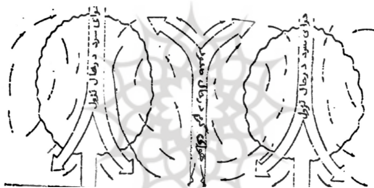
شکل ۵ - طرز گردش هوا در یک باغ میوه گرما داده شده ( کوانتا، ص ۱۸۰ )

۱. حفاظت به وسیله بخاری : بهتر است از تعداد بیشتری بخاری با شعله کم نسبت به بخاری کمتر با شعله زیاد استفاده شود. تعداد بخاری‌های مورد نیاز بستگی به نیاز حرارتی و عوامل اقتصادی دارد. گرم کردن هوایی که پیرامون باغ وارد می‌شود، راندمان مبارزه با سرما را بالایی‌برد. در یک طرح کلی برای هر دو درخت یک بخاری کفایت می‌کند ( شکل ۵ ) .