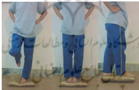
شکل ۱- اجرای آزمون BESS در سه وضعیت ایستادن روی دو پا

ارزیابی تعادل ایستا: تعادل ایستا به وسیله آزمون ارزیابی خطاهای تعادل ۲ (BESS) ارزیابی شد. در این آزمون، شش وضعیت مختلف که شامل سه وضعیت ایستادن (ایستادن روی دو پا، ایستادن به صورتی که یک پا در جلو و پای دیگر در عقب قرار دارد و ایستادن روی یک پا) بر روی دو سطح نرم و سخت بود در نظر گرفته شد. در هر وضعیت چشم‌های آزمودنی‌ها بسته بود و دست‌های آنها بر روی کمر قرار داشت. آزمودنی هر وضعیت را به مدت ۲۰ ثانیه انجام می‌داد و تعداد کل خطاهایی که در این شش وضعیت مرتکب می‌شد به‌عنوان نمره آزمودنی محاسبه شد. خطاها عبارت بودند از: دست‌ها از کمر جدا شوند، چشم‌ها باز شوند و یا تعادل به هر دلیل به هم بخورد. قبل از اجرای آزمون، آزمودنی ۳ بار آزمون را انجام دادند تا با سطوح آزمون آشنا شوند (۲) (شکل ۱).