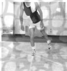
شکل ۲ - آزمودنی در حال اجرای آزمون SEBT (جهت خلفی داخلی)

ارزیابی تعادل پویا: تعادل پویا به وسیلهٔ آزمون تعادلی ستاره ۱ (SEBT) ارزیابی شد. برای اجرای آزمون تعادلی ستاره، یک ستارهٔ هشت وجهی در جهات قدامی، قدامی داخلی، داخلی، خلفی داخلی، خلفی، خلفی خارجی، خارجی و قدامی خارجی بر روی زمین ترسیم شد. آزمودنی با یک پا در مرکز ستاره می‌ایستاد و با پای دیگر سعی می‌کرد حداکثر عمل دستیابی را در هر هشت جهت انجام دهد و به نقطهٔ شروع برگردد بدون اینکه تعادل بهم بخورد. آزمودنی هر جهت را ۳ بار تکرار می‌کرد و میانگین آن به عنوان نمرهٔ خام تعادل پویا در نظر گرفته شد. طول پا (فاصلهٔ بین خار خارهای قدامی فوقانی تا قوزک داخلی پا) برای نرمال کردن نمرات خام تعادل پویا (فاصلهٔ عمل دستیابی بر حسب سانتی‌متر تقسیم بر طول پا ضرب در ۱۰۰) استفاده شد و در محاسبات آماری استفاده شد (۱۰) (شکل ۲).