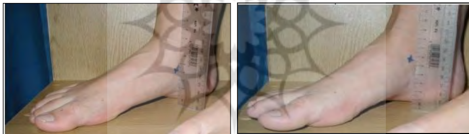
وضعیت تحمل وزن و وضعیت بدون تحمل وزن

اندازه‌گیری افت استخوان ناوی : از آزمون افت ناوی برای تعیین میزان چرخش داخل پا استفاده شد. از آزمودنی خواسته شد روی صندلی بنشیند، درحالی‌که ران و زانوی او در وضعیت فلکشن ۹۰ درجه، کف پاهای او روی زمین و مفصل ساب تالار او در وضعیت خنثی قرار داشت (بدون تحمل وزن). آزمونگر برجستگی استخوان ناوی آزمودنی را لمس و مارک کرده و فاصلهٔ آن را تا زمین با خطکش اندازه می‌گرفت. سپس از آزمودنی خواسته می‌شد در وضعیت ایستاده قرار گیرد و پاها را به اندازهٔ عرض شانه باز کند و وزن بدن را به‌طور مساوی روی دو پا قرار دهد (تحمل وزن). فاصلهٔ استخوان ناوی تا زمین دو بار اندازه‌گیری شد (شکل ۱). اختلاف بین این دو وضعیت به میلی‌متر به‌عنوان میزان افت ناوی ثبت شد (برودی). اندازه‌گیری در پای چپ و راست آزمودنی‌ها ۳ بار تکرار و میانگین آن به‌عنوان افت استخوان ناوی ثبت شد (۱۷، ۱۲، ۸).