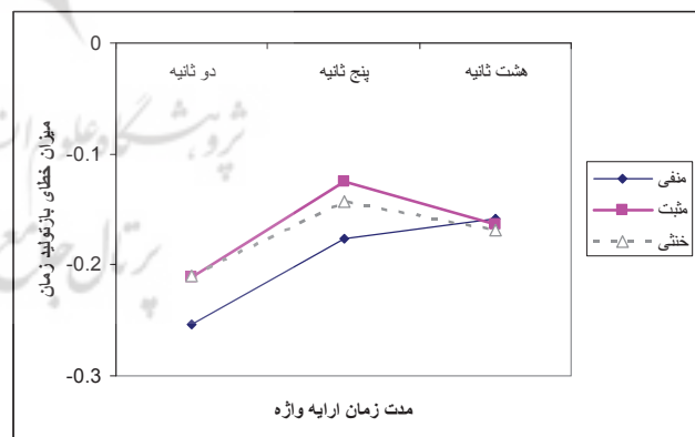
نمودار ۱- مقایسه میزان خطا در بازتولید زمان برای واژه‌های دارای بار هیجانی، به تفکیک طول مدت ارائه آنها

برای بررسی معنادار بودن تفاوت‌ها، از آزمون تحلیل