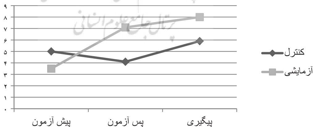
نمودار ۲- سخنان بسط دهنده بالای کودکان در پیش آزمون، پس آزمون و پیگیری