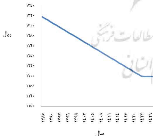
نمودار ۲- مسیر بهینه قیمت آب زیرزمینی