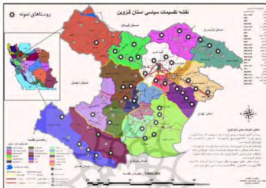
نقشه ۱: تقسیمات کشوری و توزیع فضایی روستاهای نمونه