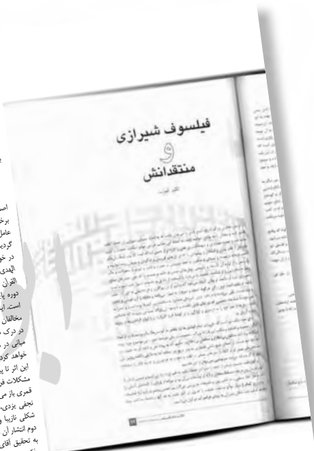
کتاب ماه فلسفه، شماره ۳۰، زمستان ۱۳۸۸