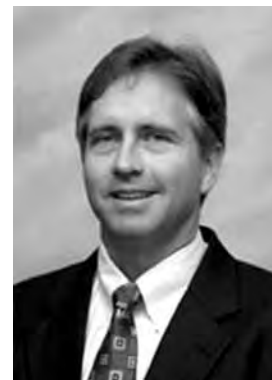
مایکل دلبلیو تیلر

شاید لازم به ذکر نباشد که این استنتاج چندان محکم و تردیدناپذیر نیست. علاوه بر این، اسپنسر هیچ گاه نتوانست قانون تطور و تکامل خود را با آنچه فیزیکدان‌ها قانون دوم ترمودینامیک نامیدند تطبیق بدهد. بر اساس قانون دوم ترمودینامیک، یا قانون آنتروپی، فرایندهای مادی کلاً به سوی پیچیدگی و ناهمگونی بیشتر پیش نمی‌روند، بلکه کاملاً