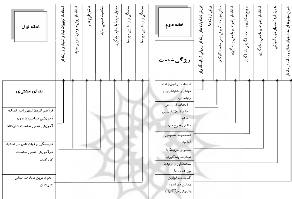
شکل ۲: ترجمان خانه به خانه ندای مشتری به ویژگی های خدمت

● برای ویژگی سوم (گنجاندن قوانینی روشن در نحوه پذیرش فراگیران) تدوین مجموعه‌ای تحت عنوان اهداف و رسالت در ساختار دوره به عنوان الزام آموزشی شناسایی شد. ترجمان خانه به خانه این سه مورد در شکل (۲) نشان داده شده است