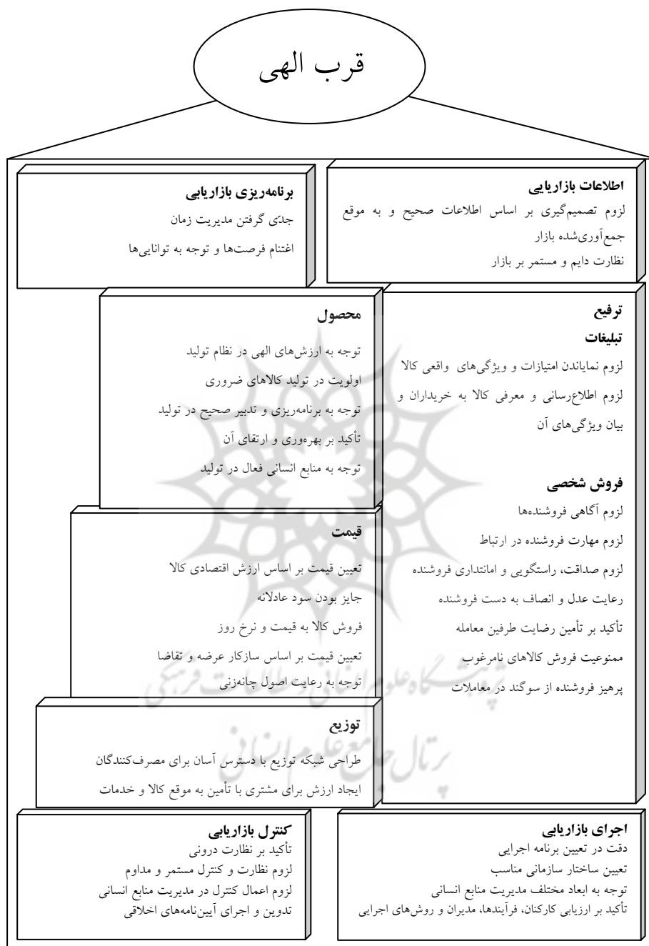
نمودار ۳. مبانی و زیرساخت‌های فرآیند بازاریابی اسلامی