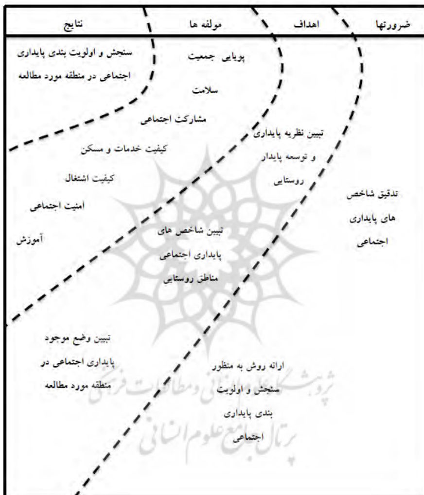
شکل ۳- مدل مفهومی و اجرایی پژوهش