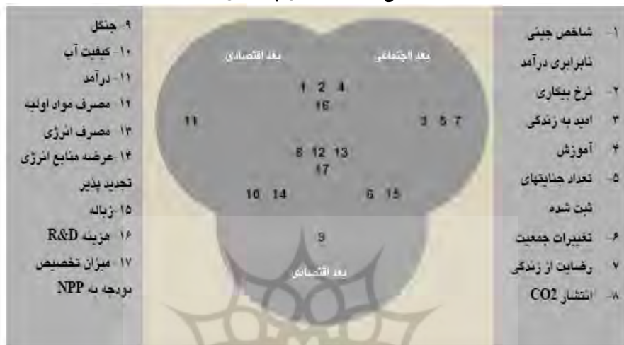
شکل ۲- معیارهای پایداری