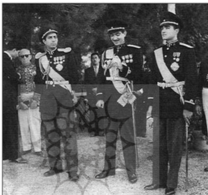
از راست عبدالرضا، غلامرضا، علیرضا، محمداکبر و حمیدرضا پهلوی (۱۲۹۵-۱۳۰۴)

از برخی سخنان او می‌توان دریافت که آزردهی و انزجار او از شاه و خاندان پهلوی تنها به جریان توطئه‌ای که به مرگ پدرش کشیده شد، محدود نبود، بلکه او از دوران کودکی و نوجوانی از دست این دودمان در درد و رنج بود و تحت فشار قرار داشت. طبق گزارش موجود او در گفتگویی با رییس ساواک گنبد اظهار کرد: