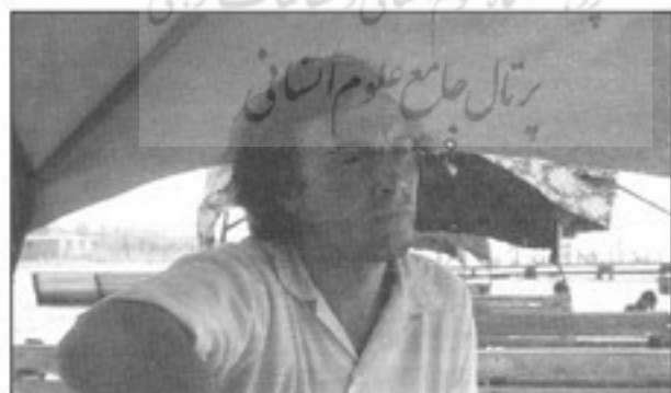
شاه پهلوی (اصلی اصل) ۱۳۲۱-۱۳۰۱ ه. ش