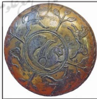
تصویر ۲. ظرف سیمین زرانود، صحنه‌های شکار و نقش سیمرغ ساسانی در وسط، مدالیون، آخر قرن ششم میلادی، موزه ارمنیاز، سن پترزبورگ.

Fig 3. Portray of Sassanid Simurgh on interior wall of a church in Armenia.