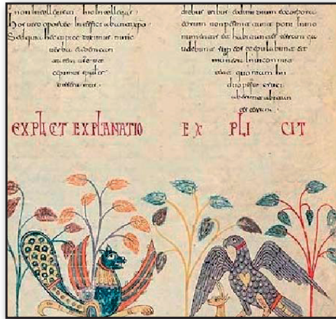
تصویر ۷. بئاتوس لیابانا، بئاتوس سن سور Saint-Sever، طاووس با دم جمع شده برگشته به بالا متأثر از دم سیمرغ ساسانی، حدود ۱۰۶۰ میلادی. کتابخانه ملی پاریس. Fig7. Beatus van Liébana, Saint-Sever Beatus. Peacock with rolled tail inspired by Sassanid Simurgh motif battling with a serpent, dating back to about 11th Century.