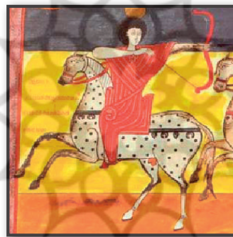
تصویر ۱۳. سمت چپ، بئاتوس فاکوندوس، Bèatus de Facundus تیرانداز سوار بر اسب، کتابخانه ملی مادرید.