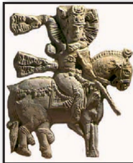
تصویر ۱۱. سمت راست، شاه ساسانی سوار بر اسب، پلاک سنگی، چل ترخه، ری، قرن هفتم و هشتم میلادی.