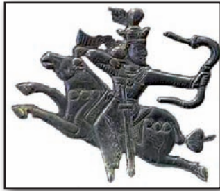
تصویر ۱۸. نقش تیرانداز سوار بر اسب، سینی سیمین با نقش خسرو دوم و چهار اشرافزاده، ساسانی، موزه ارمیتاژ. Fig18. Silver plate with the image of Sassanid King Khosrow II accompanied by four royals and an archer riding on a horse..