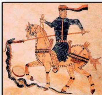
تصویر ۱۰. بئاتوس ژرون، نقش سوار کار با سربند روبان سلطنتی ساسانی، دیر سان سالوادور تابارا، موزه کاتدرال، ژرون، اسپانیا.