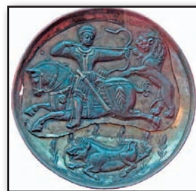
تصویر ۱۶. ظرف سیمین، ساسانی، صحنه شکار شاهی، تیرانداز سوار بر اسب، قرن هفتم میلادی، موزه ارمیتاژ. Fig16. Silver Sassanid dish showing a royal hunting scene and an archer riding on a horse, 7th Century, Hermitage Museum.