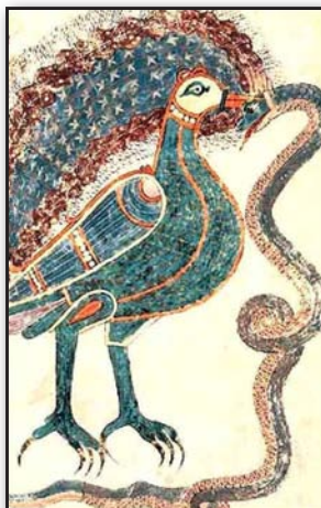
تصویر ۶. طاووس با دم جمع‌شده و برگشته به بالا، متأثر از دم سیمرغ ساسانی، در حال نبرد نمادین با مار، بتاتوس سن ژرون، حدود ۹۷۵ م.

اگر در غرب، آنها بیشتر کاربردشان برای مراسم مذهبی کلیسایی و پیچیدن اشیای مقدس مذهبی بود، در بیزانس (جایی که بسیار محبوب بوده و گسترش یافته بودند) به عنوان کالاهای لوکس استفاده می‌شدند و تولیدشان تا قرن دوازدهم میلادی نیز ادامه داشت.