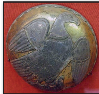
تصویر ۹. نقش عقاب و غزال در چنگال، ساسانی، موزه ارمیتاژ.