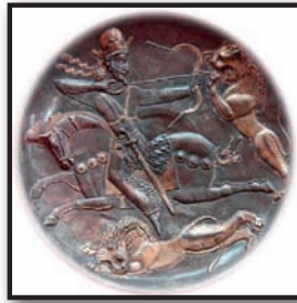
تصویر ۱۷. سمت چپ، سینی سیمین، ساسانی، شاپور دوم تیرانداز سوار بر اسب در حال شکار شیر، قرن چهارم میلادی، موزه ارمیتاژ. Fig17. On the left, a silver plate depicting Sassanid King Shapur II hunting a lion, 4th Century, Hermitage Museum.