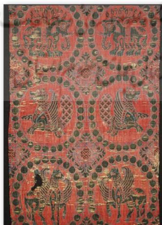
تصویر ۵. پارچه ابریشمی با نقوش فیل، اسب بالدار و سیمرغ، محل کشف دیر سانتا ماریا استای، کاتالون، اسپانیا، قرن یازدهم میلادی، موزه کوپر هویت، نیویورک.

Fig5. A piece of cloth with images of an elephant, a Pegasus and a Simurgh. The piece dates back to the 11th Century and was discovered in Santa Maria Estay, Catalan, Spain. It is now held in Cooper-Hewitt Museum, New York.