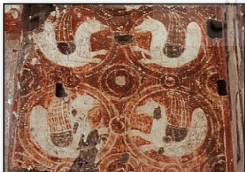
تصویر ۳. نقش سیمرغ ساسانی بر روی دیواره داخلی کلیسا، ارمنستان

کمتر تمدنی می‌تواند چنین تأثیر و گسترشی در دورترین نقاط جهان داشته باشد. هنر و شیوه ساسانی و موضوعاتش به شرق و غرب دنیای قدیم توسعه پیدا کرد، از سرامیک‌های قدیمی چین در سلسله تانگ (T'ang) تا نقش برجسته سردرهای دیر ویزیگوت ۱۰ (Wisigoth) کوینتانایلا (Quintanilla) در لاس ویناس (Las Vinas) اسپانیا، که حیوانات تخیلی و خارق‌العاده ملهم از ساسانی را عرضه می‌کنند؛ جایی که نقوش هنری، استیلیزه و تجریدی با هم می‌آمیزند. در طول سال‌های اولیه اشغال مسلمانان، عرب‌ها