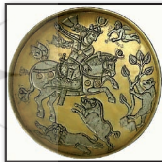
تصویر ۱۲. سینی سیمین ساسانی، صحنه شکار شاهی، قرن هفتم میلادی، موزه هنر اسلامی برلین.