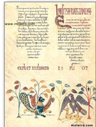
تصویر ۱. صفحه‌ای از بئاتوس، با نقش سیمرغ ساسانی و عقاب در حال شکار غزال.

Fig2. Silver vessel with the image of a hunting scene and a Sassanid Simurgh in the middle belonging to the end of 16th Century, Hermitage Museum, Saint Petersburg.