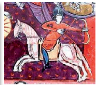
تصویر ۱۵. سمت چپ، بئاتوس لاس هولگاس، Béatus -las-huelgas تیرانداز سوار بر اسب. Fig15. On the right, the Beatus Las-Huelgas, an archer riding on a horseback.