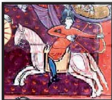
تصویر ۱۴. سمت راست، بئاتوس والادولید، Bèatus de Valladolid، تیرانداز سوار بر اسب، کتابخانه دانشگاه اسپانیا. مأخذ : www.moleiro.com