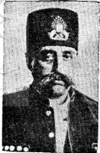
مظفر الدین شاه سفری بمراغه

مرض مظفرالدین شاه روز بروز بر شدت خود می افزود لذا در تاریخ ۱۳ شوال ۱۳۲۴ ولیعهد بطهران احضار شد و در روز ۱۷ شوال ولیعهد عازم تهران شد و در ۴ ذیحجه بطهران وارد گردید و مظفرالدین شاه شب ۲۴ ذیحجه چشم از جهان بر بست و محمد علیشاه وارث تاج و تخت ایران گشت.