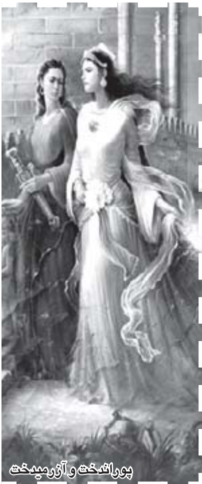
پوراندهخت و آرم‌دخت