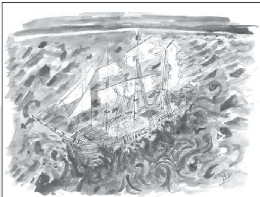
طرح از میلاد موسوی