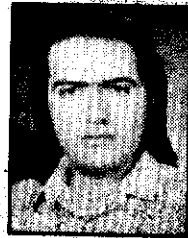
ترجمه و تالیف: محمد صادق امینی