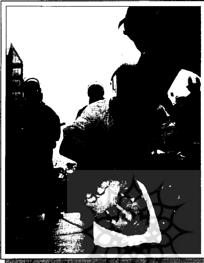
آمریکاییان هم از برنامه جهانی کردن اقتصاد به خشم آمده‌اند. بعد از تظاهرات سیاتل، در واشنگتن هم علیه سیاست‌های بانک جهانی و صندوق بین‌المللی پول تظاهراتی برپا شد. عکس برخورد خشونت‌آمیز پلیس واشنگتن با تظاهرکنندگان را نشان می‌دهد.

در هفته آخر فروردین ۱۳۷۹، حامیان کشورهای در حال توسعه و مخالفان اقتصاد جهانی، پس از تظاهرات «سیاتل» در ایالت واشنگتن، تظاهراتی را در مقابل مرکز بانک جهانی و صندوق بین‌المللی پول در واشنگتن دی سی نیز برپا کردند. آنها می‌گویند که جریان سرمایه و پول در بازار جهانی با فراز و نشیب‌های کنونی، غیرواقعی به نظر می‌رسد. مخالفان اقتصاد جهانی مثال می‌زدند که بر اثر ماجرای «بیل گیتس» صاحب کمپانی «مایکروسافت» و اغتشاشی که در بورس «وال استریت» بوجود آمد، نزدیک به ۲ هزار میلیارد دلار سرمایه از بین رفت. آنها همچنین معتقدند که کشورهای قدرتمند، بر صندوق بین‌المللی پول حاکم هستند و برنامه‌های توسعه آنان بر کشورهای فقیر، ثمری جز افزایش صادرات کشورهای توسعه یافته به بهای تنزل توان اقتصادی کشورهای فقیر ندارد. به گفته کارشناسان، تظاهرکنندگان سخنگوی بخش عظیمی از افکار عمومی جهان محسوب می‌شوند که از اصلاحات پیشنهادی این نهاد مالی بین‌المللی متضرر می‌شوند.